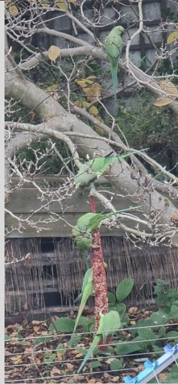
14/11, trosje halsbandparkieten , binnenstadstuin, Delft, Frans Geerlink