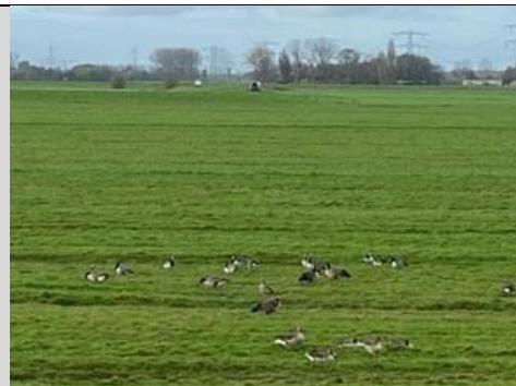
14/11, brandganzen , Woudse polder, Gedi van Nieuwkerk