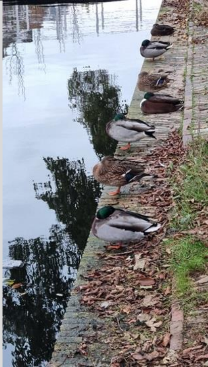
15/11, eenden wachtend op de komst van de Sint!, Rietveld, Delft, Frans Geerlink