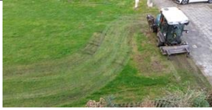
14/11, ja het gras moet dringend (?) weer worden gemaaid, plantsoen Aziëlaan, Delft, Lia Claus