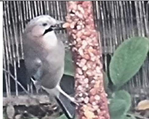
14/11, even later kwam de gaai langs!, binnenstadstuin, Delft, Frans Geerlink