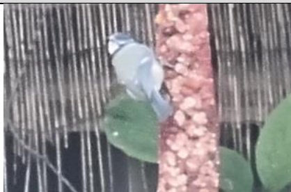
14/11, een komen en gaan bij het pindasnoer: Nu een koolmees , wel rap weer weg, binnenstadstuin, Delft, Frans Geerlink