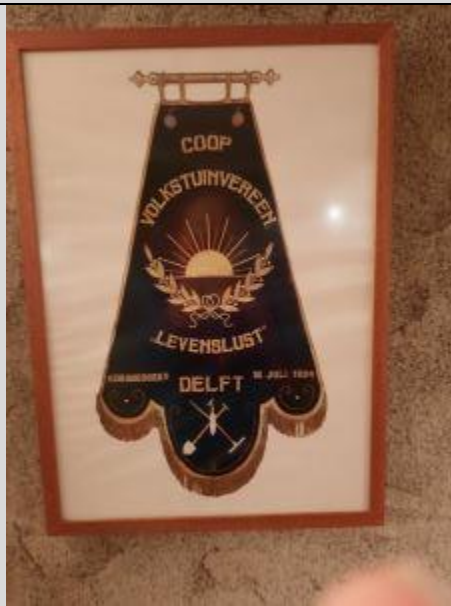
Vijvertuinen is een complex van Levenslust, in 1924 opgericht.