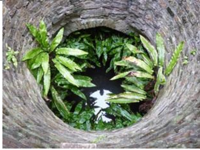
tongvaren in de waterput