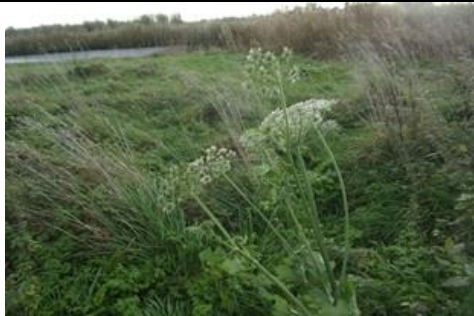
17/11, bloeiend in de herfstwind, Tanthof, Delft, Freek Boon

14 november, kolganzen , voor mij te ver weg om te fotograferen. Ook deze wintergasten weer in ons land, Woudse polder, Gedi van Nieuwkerk