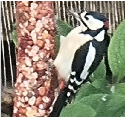
14/11, ook de grote bonte specht weet een pindasnoer te waarderen, binnenstadstuin, Delft, Frans Geerlink