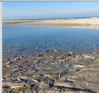
4/11, aangespoelde scheermessen, Kijkduin, Lia Claus