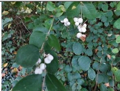
7/11, sneeuwbesen , Syriësingel, Delft, Lia Claus