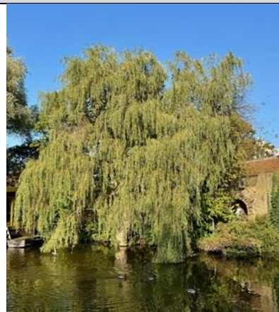
5/11, wilg (salix), Oostpoort, Delft, Bart Hendriks