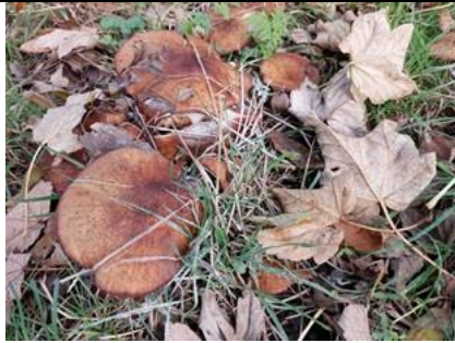
5/11, sombere honingzwam , Kabouterpad, Tanthof, Delft, Lia Claus