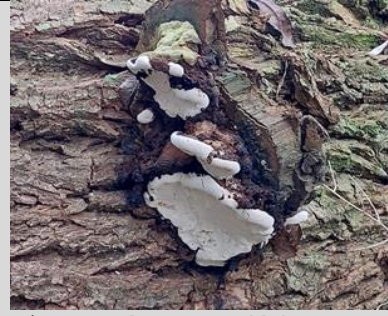
5/11, tonderzwam , Kabouterpad, Tanthof, Delft, Lia Claus