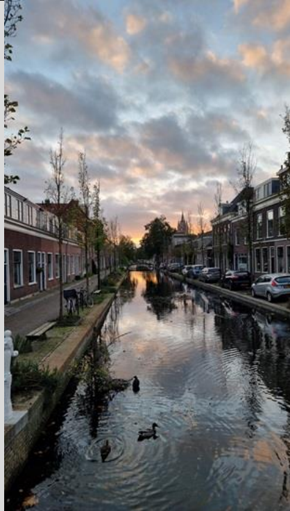
2/11, mooie namiddagvlucht, met enkele eenden in de gracht, Rietveld Delft, Frans Geerlink