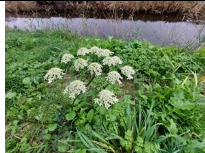
5/11, gewone berenklaauw , Kabouterpad, Tanthof, Delft, Lia Claus