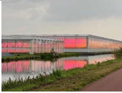
5/11, glastuinbouwbedrijf met LED-lampen, Pijnacker, Bart Hendriks