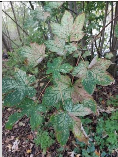
5/11, esdoorn , Kabouterpad, Tanthof, Delft, Lia Claus