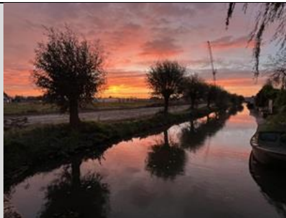
29/10, wilgen bij zonsopgang, 's-Gravenzande, Dick Voogd