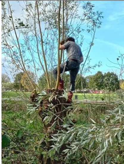
Acrobatiek aan de Kwartelstraat