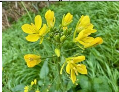
23/10, raapzaad (brassica), Delfgauw, Bart Hendriks

Zie de foto van de boomspiegel ik heb van een struik beneden een stukje afgeknipt en iets wat op klimop lijkt ook en een stuk geranium ook in de grond gezet en zie het resultaat.