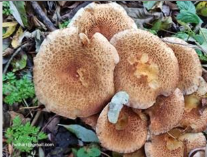
25/10, schubbige bundelzwam overvloedig aanwezig op Tanthofkade, Tanthof West, Delft, Huub van 't Hart