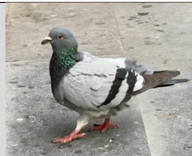
23/10, stadsduif , Delft centrum, Bart Hendriks