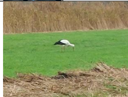
31/10, ooievaar , polder van Biesland, Lia Claus