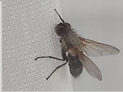
23/10, huisvlieg op het gordijn, Tanthof west, Delft, Lia Claus