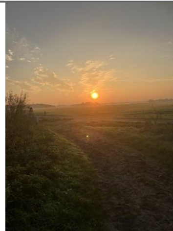
25/10, opkomende zon, Bruun van der Steuijt