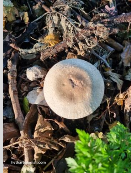
25/10, parelhoenchampignon , overvloedig aanwezig op Tanthofkade, Tanthof West, Delft, Huub van 't Hart