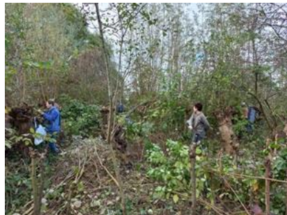
of bosjes mannen?