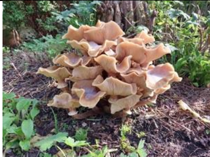
26/10, trechter oesterzwam , Haagwegbos, Wilco Vos