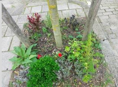
17/10, boomspiegel, Azielaan, Delft, Lia Claus

Nb. De afspraak in de vogelwereld is dat foto's met nesten en eieren niet worden gepubliceerd om ze niet te verstoren. We zullen dus alleen de waarneming in de Nieuwsbrief opnemen.