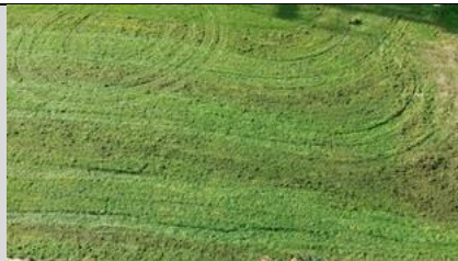
25/10, plantsoen Aziëlaan plat gemaaid, Delft, Lia Claus