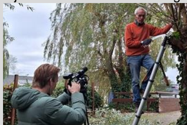
uitleg vanaf de trap