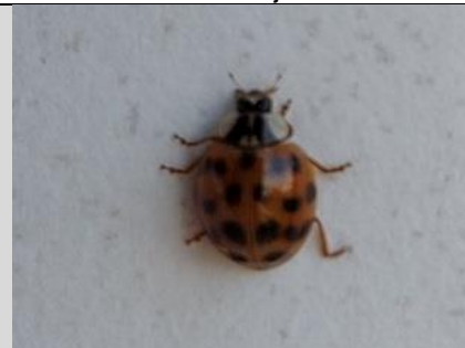
25/10, Aziatisch lieveheersbeestje , Lia Claus