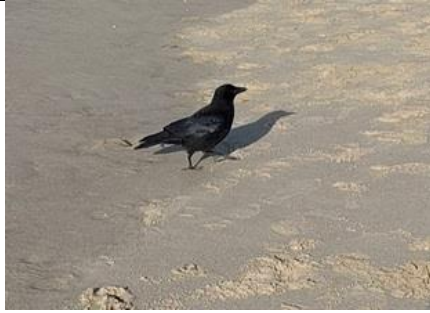
2/11, zwarte kraai, Kijkduin. Lia Claus