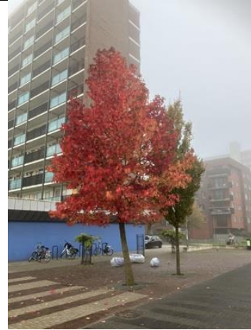
24/10, de bladeren verkleuren .....Herfst Bruun van der Steuijt