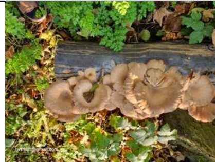
25/10, gewone oesterzwam , overvloedig aanwezig op Tanthofkade, Tanthof West, Delft, Huub van 't Hart