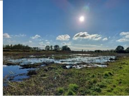
14/10, veel regenwater, Tanthofkade, Delft, Lia Claus