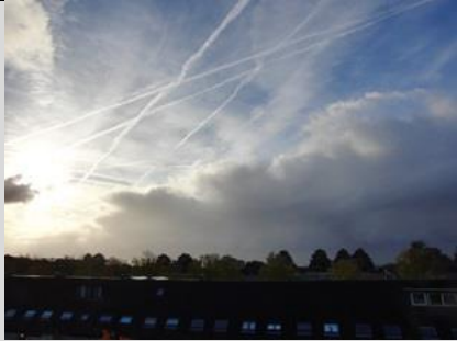
13/10, zon, bui, condensstrepen, Syriësingel, Delft, Aukje Gjaltema