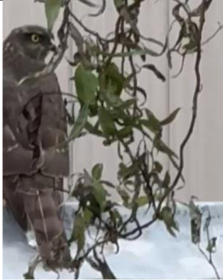
17/10, sperwer op de schuur, Kwartelstraat, Delft, Jet van 't Woudt