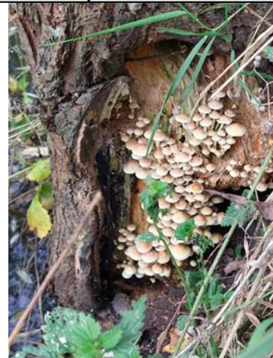
19/10, gewone zwavelkop op knotwilg , waargenomen bij het knotten langs het Meerkoetpad, Tanthof, Delft, Niels van Buren