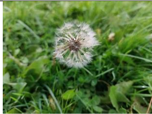
20/10, paardenbloem uitgebloeid , World Art Centre, Delft, Lia Claus