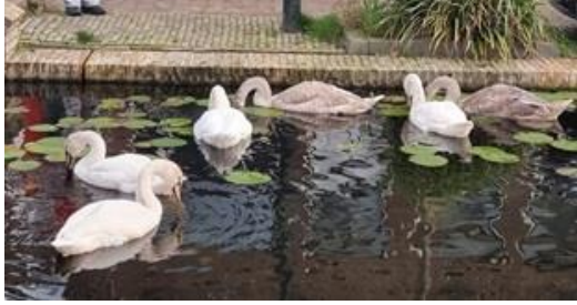
13/10, eerst waren alleen pa en ma in de gracht, maar nu is de familie zwanen weer compleet!, Rietveld, Delft, Frans Geerlink