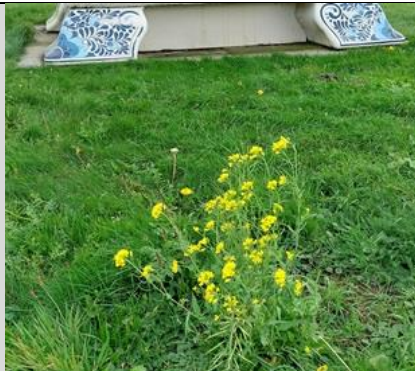
20/10, raapzaad , World Art Centre, Delft, Lia Claus