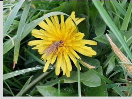
20/10, paardenbloem met zweefvlieg , World Art Centre, Delft, Lia Claus