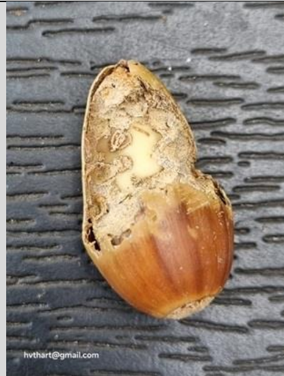
16/10, hazelnoot met muizensporen , Kwarteltuin, Delft, Huub van 't Hart