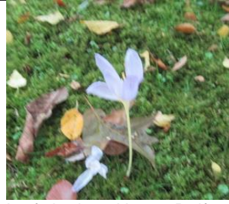
herfstkrokus, Hortus Delft

Ik dacht dat ik in de Hortus van de TUD herfsttijloos in volle bloei zag, zowel verspreid in het gras als in een bloembak bij de uitgang. Waarneming.nl zei: herfstkrokus! In de flora Heukels-Duistermaat staat de oplossing: herfsttijloos heeft 6 meeldraden en de herfstkrokus 3. Op blz. 137 staat overigens een verkeerde verwijzing naar de herfsttijloos het is niet soort 34.1 maar 37.1 . Ik ben niet teruggegaan om alles te checken maar zal nu al die bloeiende paarsroze bloemen waarschijnlijk als herfstkrokus moeten benoemen. Op zoek naar de fossiele conifeer in het Heempark [ Wollemia ] zag ik nog een fraaie opbloei van uiltig judasoor .