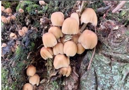
15/10, gewone glimmerinktzwam , Tanthofkade, Delft, Lia Claus