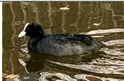
16/10, meerkoet ( fulica ), Delfgauw, Bart Hendriks