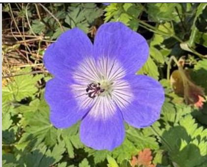
16/10, beemdooievaarsbek ( geranium pratense ), Delfgauw, Bart Hendriks