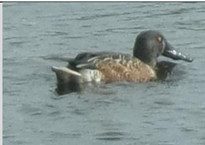
6/10, slobeend , Freek Boon