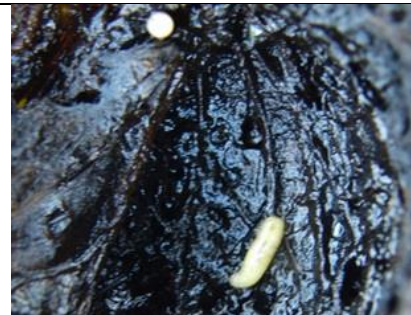
8/10, walnootboorvlieg larven, Aukje Gjaltema