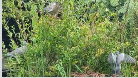
13/10, houtduiven (3x) moeizaam fladderend in één struik, binnenstadstuin Rietveld, Delft, Frans Geerlink