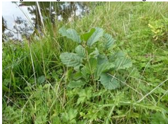
en de nieuwe poel