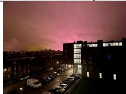
1/10, nachtelijke glastuinbouw verlichting , Delfgauw, Bart Hendriks