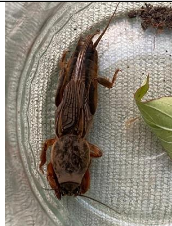
5/10, veenmol , Kindertuin de Boterbloem, Delft, Aukje Gjaltema