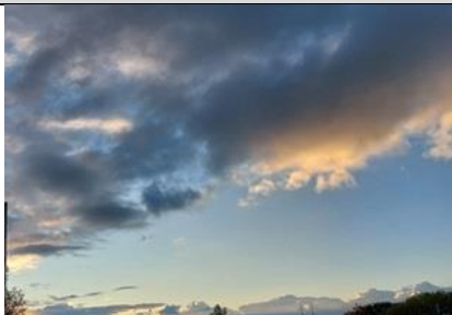
1/10, 19.00 uur, ondergaande zon richting Schipluiden, Lia Claus