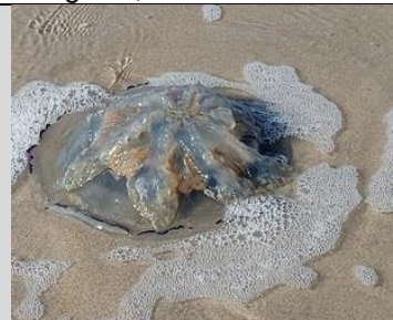
4/10, reuzenkwal , Kijkduin, Lia Claus