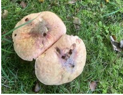
29/9, netstelige heksenboleet , Bruun van der Steuijt