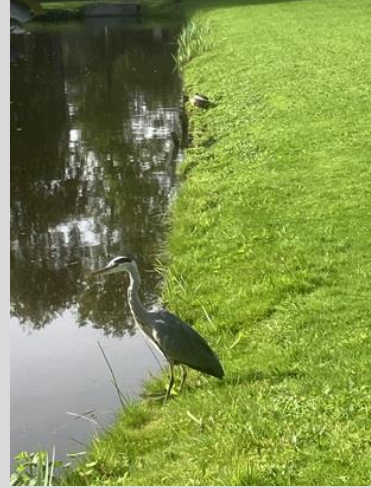
1/10, Bruun van der Steuijt