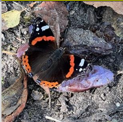
1/9, atalanta , Schepen, Naaldwijk, Aad van Uffelen

Nb. De afspraak in de vogelwereld is dat foto's met nesten en eieren niet worden gepubliceerd om ze niet te verstoren. We zullen dus alleen de waarneming in de Nieuwsbrief opnemen.