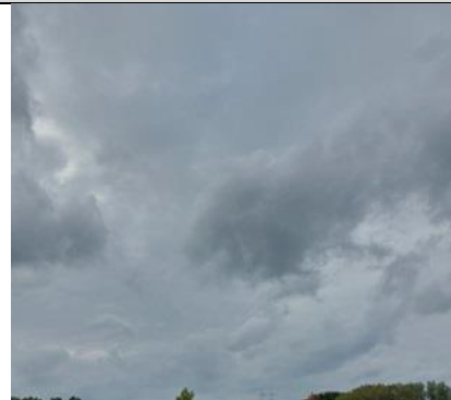
25/9, regenbui op komst richting Kerkpolder. Er waren ook 2 buizerds , Lia Claus