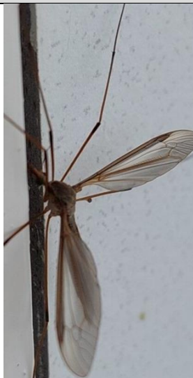
26/9, langpootmug , Delft, Lia Claus