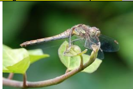
1/9, bruinrode heidelibelle , Schepen, Naaldwijk, Aad van Uffelen