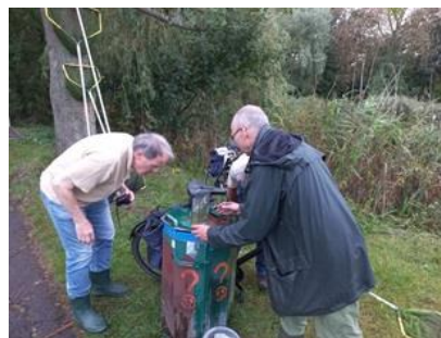
Team schepnetvissen in actie aan de Tweemolentjesvaart

De start was slecht want we schepten alleen maar Amerikaanse rivierkreeften . Daarna hadden we meer succes met een tiental driedoornige stekelbaarzen , kleine modderkruiper , bittervoorn en baars . Bovendien weer een groot aantal juveniele exoten van de Kaukasische dwerggrondel , ca. 50 stuks. Uiteindelijk wel vijf soorten, maar de aantallen waren laag. De plaag van de exoten, Amerikaanse rivierkreeften en exotische grondels, lijkt toch wel invloed te hebben op onze inheemse vissoorten.