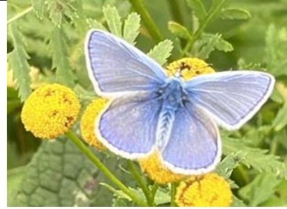
23/9, heideblauwtje , nabij Ackerdijkse Plassen, Theun Frankema