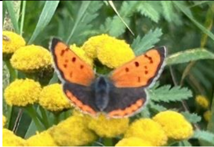
23/9, kleine vuurvlinder , nabij Ackerdijkse Plassen, Theun Frankema