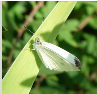
1/9, klein koolwitje , Schepen, Naaldwijk, Aad van Uffelen