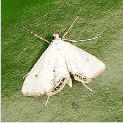
1/9, kroosvlindertje , Schepen, Naaldwijk, Aad van Uffelen