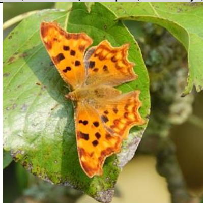
1/9, gehakkelde aurelia , Schepen, Naaldwijk, Aad van Uffelen