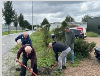
aan het werk!