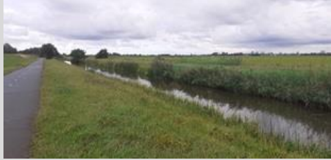
11/9, het blijft 'n mooi gebied zo tussen drie steden met m'n racefiets rij ik er wel 2 tot 3 keer doorheen, Midden Delfland, Kees van der Knaap.