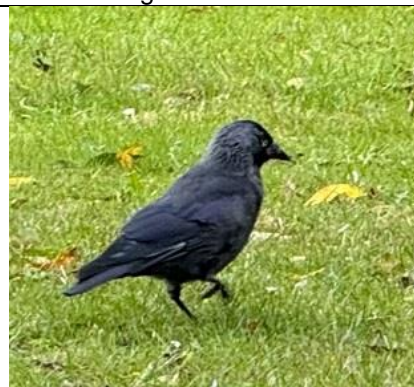
11/9, kauw (coloeus), Delfgauw, Bart Hendriks