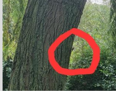
13/9, boomkruiper op treurwilg , Kwartelstraat, Delft, Huub van 't Hart.