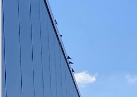
13/9, zwaluwen , dierenopvangcentrum Westland, Vierschaar, 's-Gravenzande, Arie Camfferman