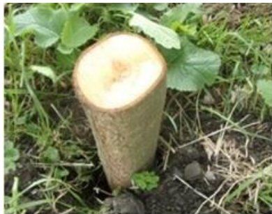
8/9, Bonsai knotwilg, Abtswoude, Delft, Freek Boon

Nb. De afspraak in de vogelwereld is dat foto's met nesten en eieren niet worden gepubliceerd om ze niet te verstoren. We zullen dus alleen de waarneming in de Nieuwsbrief opnemen.