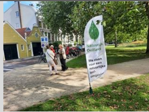
Start van de wandeling