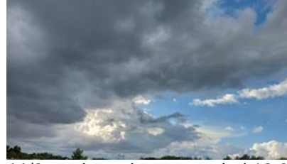
11/9, naderende onweersbui 18.05 uur Tanthof Aziëlaan richting Schipluiden, Lia Claus