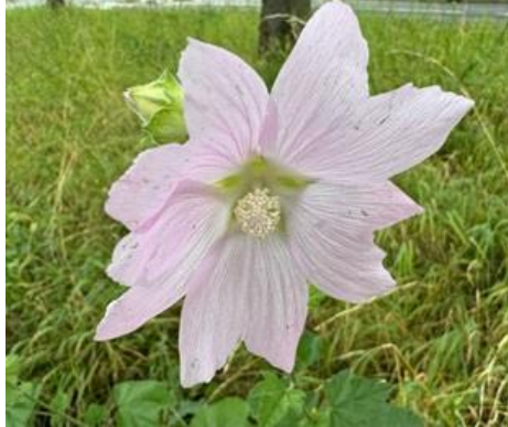
12/9, stokroos (alcea), Delfgauw, Bart Hendriks