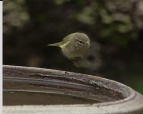
6/9, tijftjaf met jong in de tuin, Bernadette