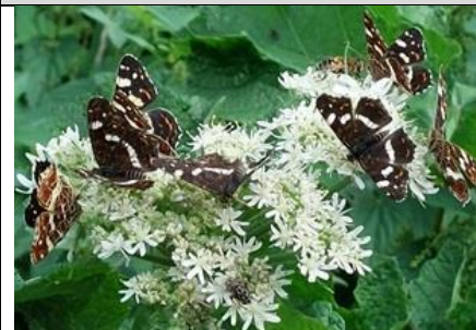
4/9, veel vlinders , Melarium, Delft, Lia Claus