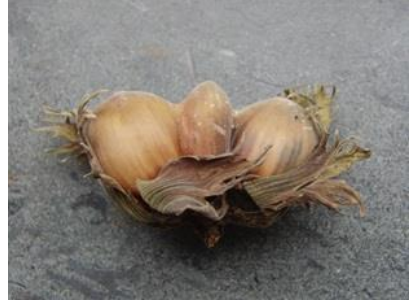
8/9, deze week al 2x een siamese hazelnoot drieling gevonden, Aukje Gjatema