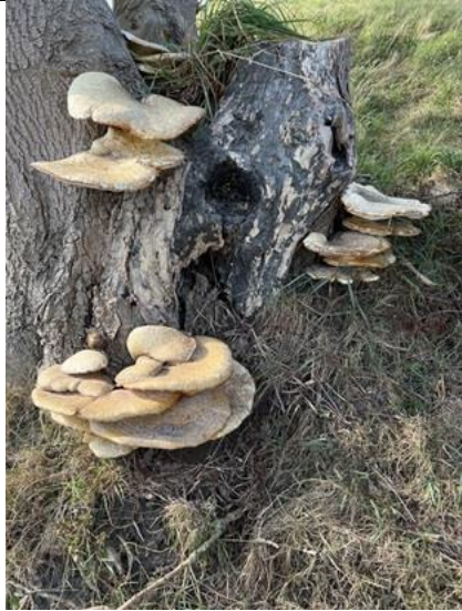
2/9, flinke zadelzwam op een es , onderaan de Maasdijk, Aad van Uffelen