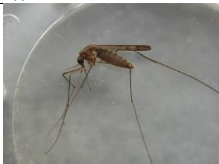
8/9, malariamug , Syriësingel, Delft, Aukje Gjaltema

Dit weekend al 2 malariamuggen in huis gevangen/doodgemept, en inmiddels mogelijk een derde.