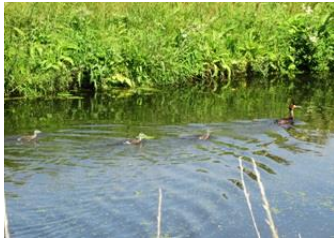
Drie jonge futen

Vaart in Delfgauw: fuut met drie jonge futen ! Verder nog twee ooievaars in het weiland achter IKEA