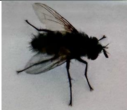
4/9, bromvlieg , Delfgauw, Bart Hendriks