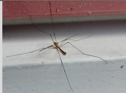
8/9, langpootmug , Aziëlaan, Delft, Lia Claus