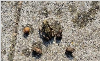
Jonge padden op de Rijnweg.

Nog een merkwaardig ontkenning van de feiten door OBWZ. Door het plaatsen van schermen in de duinvallei zouden er geen kikkers en padden meer zijn in Watergat, en zeker niet de beschermde rugstreeppad. Nu hebben de bewoners van de Rijnweg te maken met wat je een tsunami van rugstreeppadden en kikkers kunt noemen. Ze zaten in vrijwel alle tuinen. Je moet oppassen dat je er niet op ging staan! Maar dat ze ook in duinvallei Watergat zelf zaten – ondanks de schermen – bleek op 29 augustus. De firma Berkhout uit Schipluiden was ingehuurd om het gras te maaien en de slootjes schoon te maken. De werkzaamheden moesten echter gestopt worden, omdat grote aantallen kikkers en padden voor de trekker uitsprongen.