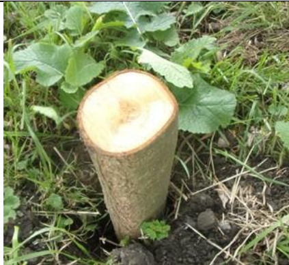
8/9, Bonsai knotwilg , Abtswoude, Delft, Freek Boon