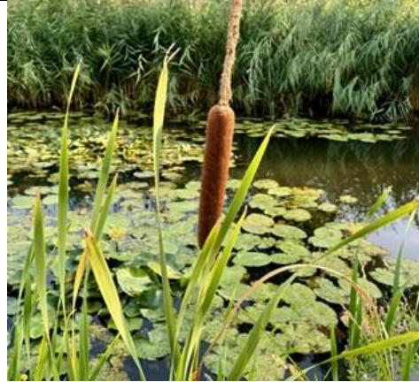
4/9, Iisdodde , Delfgauw, Bart Hendriks