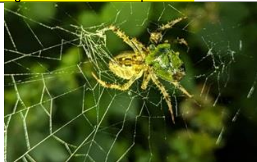
2/9, spin vangt schildwants , Den Hoorn, Willemein Poot