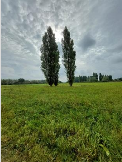
4/9, populieren , Melarium, Delft, Lia Claus