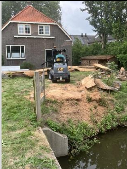
3/9, oude omgezaagde iep verzaagd voor hergebruik, Abtswoude, Delft, Bruun van der Steuijt

De oude omgezaagde iep op Abtswoude schuin tegenover Gerard van Winden (bij het voormalige buurthuis De Boerderij) is vandaag in delen gezaagd voor hergebruik