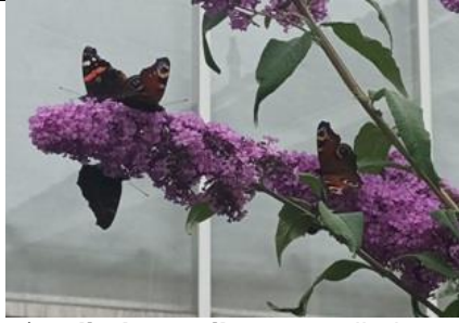
7/9, vlinderstruik met 23 vlinders, 4 koolwitjes en 1 gehakelde aurelia , verder atalanta's en dagpauwogen , Nick Groenewegen