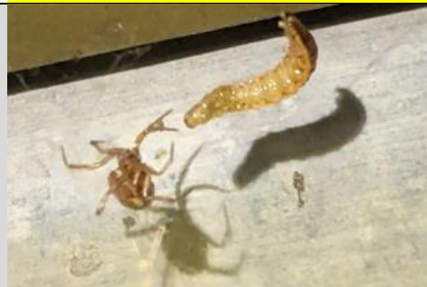
2/9, spin vangt rups , Den Hoorn, Willemein Poot

Nb. De afspraak in de vogelwereld is dat foto's met nesten en eieren niet worden gepubliceerd om ze niet te verstoren. We zullen dus alleen de waarneming in de Nieuwsbrief opnemen.