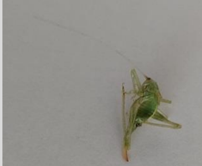
8/9, restant boomsprinkhaan in de vensterbank, Aziëlaan, Delft, Lia Claus