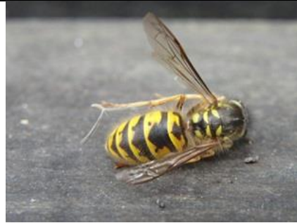
7/9, verdronken wesp , Aukje Gjaltema