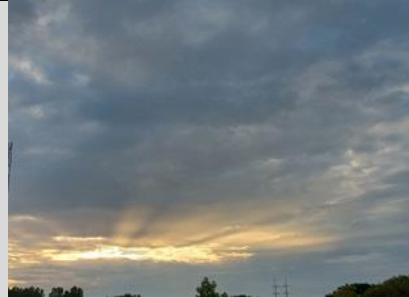
7/9, ondergaande zon met regen wolkenlucht Tanthof west richting Schipluiden, Lia Claus