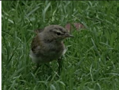
6/9, tijftjaf (?) met jong in de tuin, Bernadette