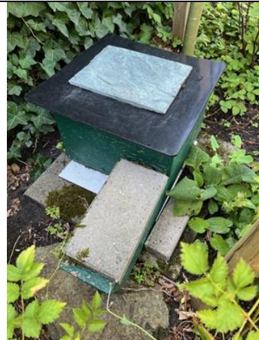
25/8, na jaren is ons inmiddels oude egelhuisje wat ik zelf heb gemaakt bewoond. 😊❤️😊❤️😊❤️😊, Aad van Uffelen