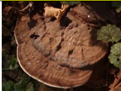
18/8, platte tonderzwam , De Tempel, Rotterdam-Overschie, Freek Boon

Nb. De afspraak in de vogelwereld is dat foto's met nesten en eieren niet worden gepubliceerd om ze niet te verstoren. We zullen dus alleen de waarneming in de Nieuwsbrief opnemen.