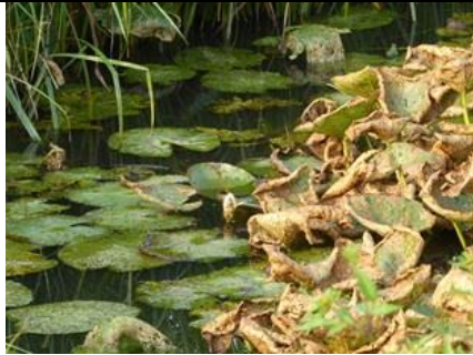
19/8, witte waterlelie heeft het moeilijk in de Poelzone, Monster