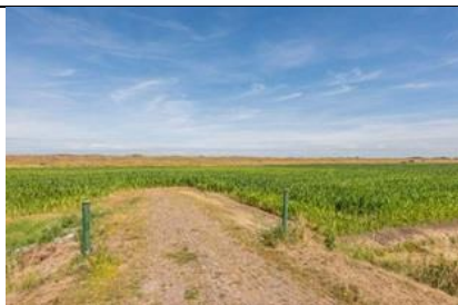
25/8, maïsveld aan de Rijnweg, Peet Kleer