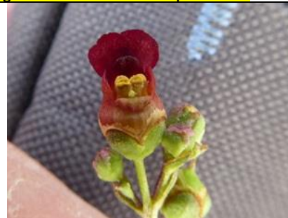
19/8, geoord helmkruid in de Poelzone, Vlaardingen, Cor Nonhof