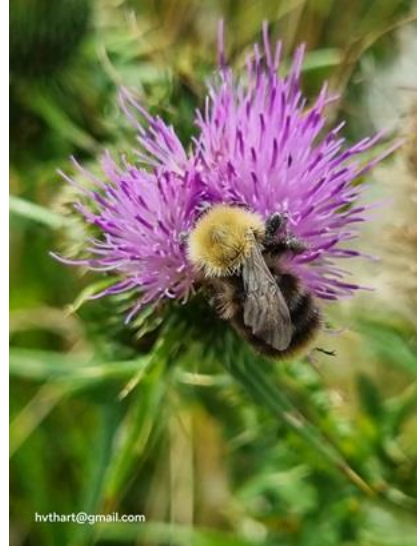
31/7, akkerhommel op akkerdistel , Natuurspeeltuin Abtswoudse Bos, Delft