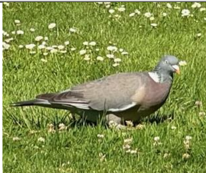
30/7, houtduif , Delfgauw, Bart Hendriks