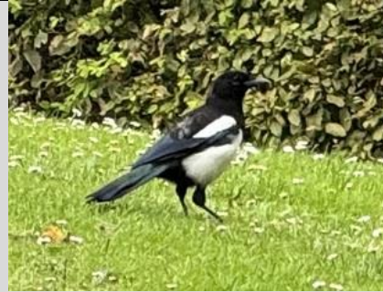
28/7, ekster (pica), Delfgauw, Bart Hendriks

Waterpunge is een vrij algemene plant die vooral in het westen van het land voorkomt. Toch wordt deze niet zo vaak gevonden in onze regio. Maar misschien komt dat ook doordat de kleine witte bloemetjes niet erg opvallen.