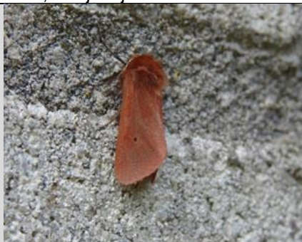
24/7, kleine beer ( Phragmatobia fuliginosa , nachtvliinder, Syriësingel, Delft, Aukje Gjaltema)