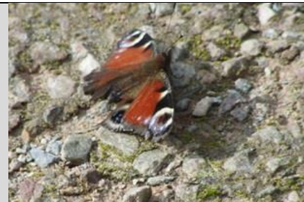
22/7, dagpauwoog , Abtswoudsepark, Delft, Aukje Gjaltema