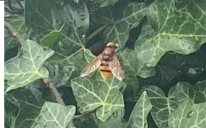
31/7, zwartvleugelstekelwapenvlieg , Claudia