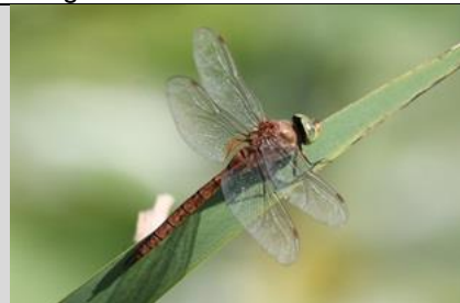
30/7 vroeg glazenmaker , Tweemolentjesvaart Delft, Patrick Ehlert De vroeg glazenmaker is een libel die 20 jaar geleden nog vrij zeldzaam was, maar die inmiddels vrij algemeen is. Je kunt ze vooral in mei en juni tegenkomen, dus de drie die rondvlogen boven de Tweemolentjesvaart waren "late" vroeg glazenmakers.