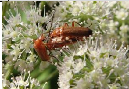
22/7, kleine rode wekschild , Abtswoudsepark, Delft, Aukje Gjaltema