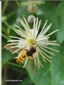
4/8, snorzweefvlieg op bosrank , Kwarteltuin, Delft, Huub van 't Hart.