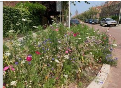
2/8, hoek Westplantsoen / van der Heimstraat, Delft. De vernieuwde boomsingels zijn door de gemeente ingezaaid met een bijen vriendelijk zaadmengsel. Het zoemt aan alle kanten en het ziet er fantastisch uit!, Margreet Hogeweg