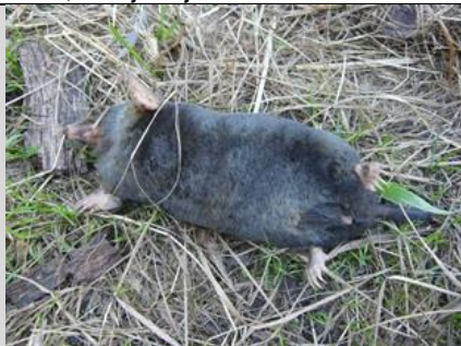
22/7, dode mol , Abtswoudsepark, Delft, Aukje Gjaltema

Op het pad zat wel een klein uitgevallen dagpauwoog te zonnen. Een stukje verderop langs het pad lag en dode mol . De bloeiende gewone engelwortel was de enige waar wat insecten op zaten. Vooral heel veel parende soldaatjes ( kleine rode wekschild ).