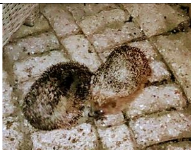
2/8, twee egels , mannetje en vrouwtje, maken veel herrie tijdens hun liefdesavonturen,