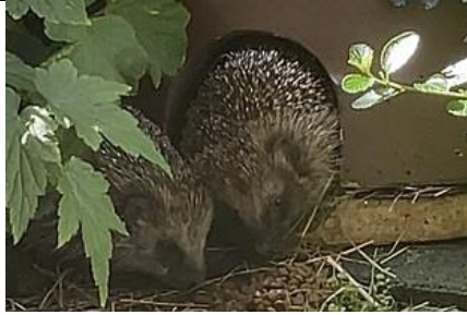
31/7, egels in de tuin, Bernadette Stofregen