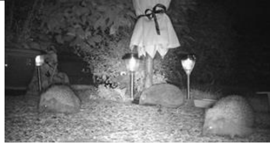
31/7, egels in de tuin, Bernadette Stofregen