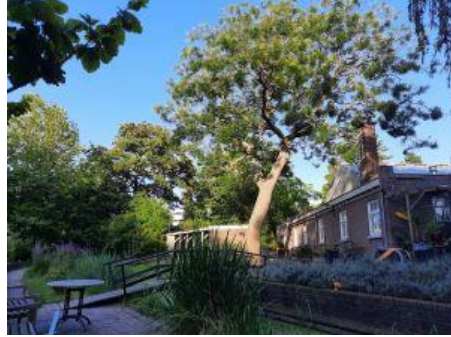
Het paradijs in Delft, Geert