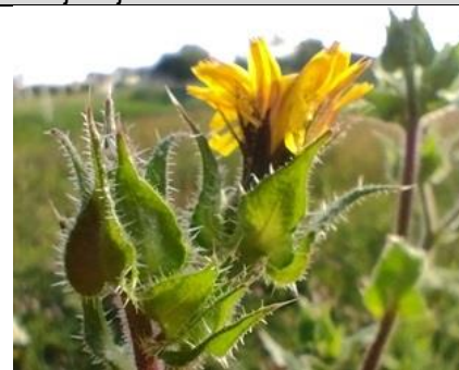
24/7, dubbelkelk , Provincialeweg, Delft, Annelies de Zeeuw