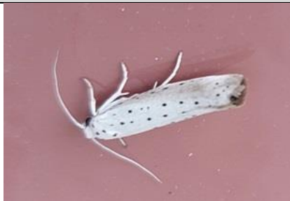
1/8, appelstippelmot , Lia Claus