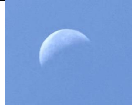
30/7, halve maan (overdag), Bart Hendriks, Delfgauw