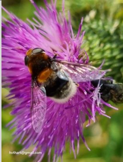
31/7, hommelbijvlieg op akkerdistel , Natuurspeeltuin Abtswoudse Bos, Delft, Huub van 't Hart