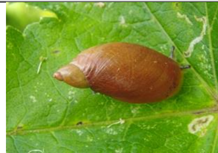
22/7, gewone barnsteenslak, Abtswoudsepark, Delft, Aukje Gjaltema