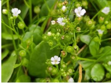
25/7, waterpunge , Sint Jorisweg Delft, Patrick Ehlert

Waterpunge is een vrij algemene plant die vooral in het westen van het land voorkomt. Toch wordt deze niet zo vaak gevonden in onze regio. Maar misschien komt dat ook doordat de kleine witte bloemetjes niet erg opvallen.