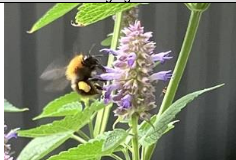
31/7, akkerhommel ( Bombus pascuorum ), Bruun van der Steuijt