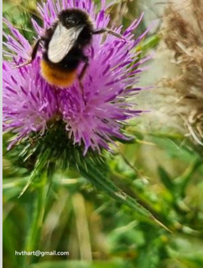
31/7, stenhommel op akkerdistel , Natuurspeeltuin Abtswoudse Bos, Delft, Huub van 't Hart