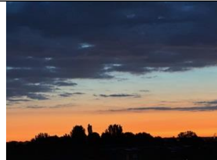
24/7, 5.00 uur, zonsopgang boven Delfgauw, Bart Hendriks