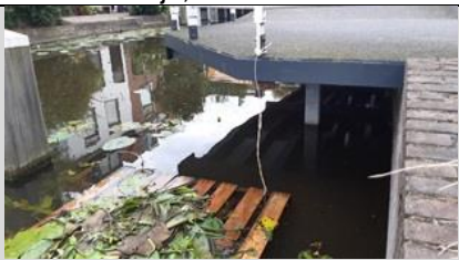
19/7, meerkoet nest, Ceciel

19 juli, vanmorgen rond 11.30 vlogen er 8 tot 10 gierzwaluwen boven de Dijkstraat in Honselersdijk, J. v.d. Hooven