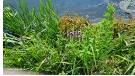
15/7, moerasandoorn en moerasspirea , oever Poldervaart, Noordkade, Lage Bieslandse Polder, Huub van 't Hart

De in de Poldervaart gebruikelijke grote drijftillen met krabbescheer waren niet te zien.