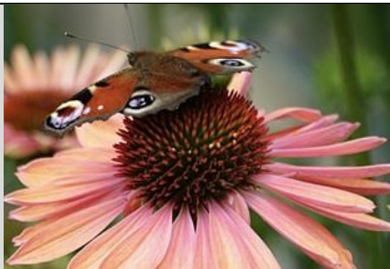
25/7, dagpauwoog , Bernadette

In de plasdras langs de Korftlaan staan op deze warme dag de pinken van Jan Duijndam in het water af te koelen. In het weiland erachter staan maar liefst negen ooievaars . In de lucht vier visdieven aan 't ruzieën.