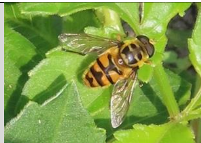
24/7, doodskopzweefvlieg , Schipluiden, Willemein Poot