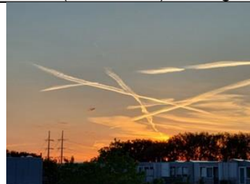
20/7, ondergaande zon 21.40 uur, Tanthof west richting Kerkpolder, Lia Claus