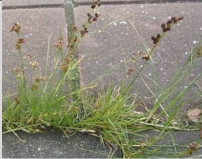
21/7, platte rus , tunneltje Kruithuisweg, Delft, Freek Boon

Deze platte rus groeit hier nu veel weelderiger dan vorig jaar. Ik schreef overigens een stukje voor het AD Delft over dit straatplantje, onder verwijzing naar het boekje Stoeplanten - waar deze rus overigens niet instaat.