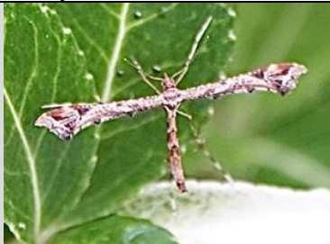
23/7, scherphoekvedermot , Bernadette

Krakeend met 8 foeragerende jonkies (2 op de foto te zien). Ma Krakeend houdt alles goed in de gaten terwijl de jonkies onverstoord foerageren, ondanks passerende auto's en fietsers (waaronder ik), alle dieren pal tegen de stoeprand aangedrukt. Pas toen een wandelaar over de stoep aankwam gingen de jonge krakeenden de stoep op naar ma krakeend en verdwenen ze alle in de naastgelegen bosjes. Vermoedelijk aten ze iepezaadjes.