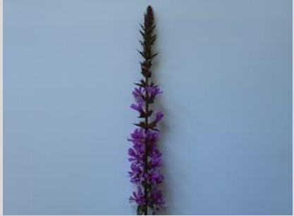
28/7, grote kattenstaart (lythrum), Delfgauw, Bart Hendriks

Er ligt weer een groen laagje op heel wat sloten, waarschijnlijk blauwalg. Ik heb wat slootwater onder de microscoop gelegd, en het krioelde van leven: waarschijnlijk diverse eencellige beestjes. Of er ook blauwalg tussen zat is met met microscoopje helaas niet te zien, hij vergroot niet genoeg.