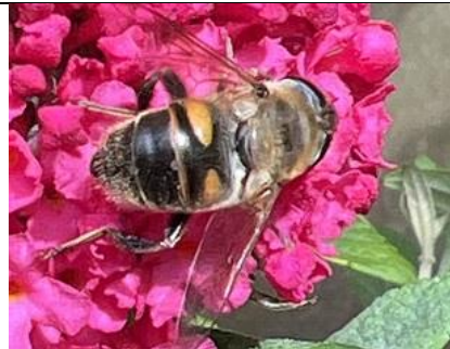
18/7, blinde bij , Westlands museum, Honselersdijk, Aad van Uffelen