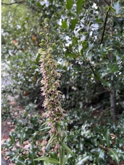
?/7, brede wespenorchis , Pijletuinenweg, Naaldwijk

hier ook, maar let op: ze zijn nog niet rijp: ze vallen met jasje en steeltje, doordat de halsbandparkieten er al van eten. Als ze echt rijp zijn vallen ze uit hun jasje. Aukje Gjaltema