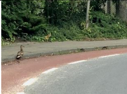
21/7, krakeend met 8 jongen, Schieweg, Delft, Geesje Veenbaas

Deze platte rus groeit hier nu veel weelderiger dan vorig jaar. Ik schreef overigens een stukje voor het AD Delft over dit straatplantje, onder verwijzing naar het boekje Stoeplanten - waar deze rus overigens niet instaat.