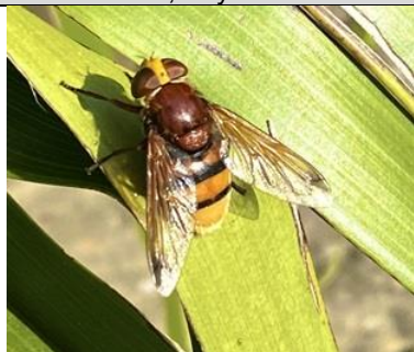
20/7, stadsreus , Hoek van Holland, Erwin Zimmerman