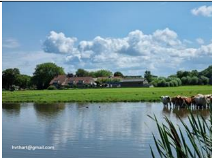
24/7, afkoelende pinken, Korftlaan, Delft, Huub van 't Hart

In de plasdras langs de Korftlaan staan op deze warme dag de pinken van Jan Duijndam in het water af te koelen. In het weiland erachter staan maar liefst negen ooievaars . In de lucht vier visdieven aan 't ruzieën.