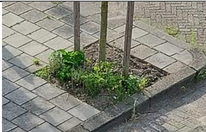
20/7, boomspiegel met lavendel en aster . De plantsoen dienst heeft ze niet weg geschoffelt, Bravo! Meer groen in de wijk wie volgt. Lia Claus