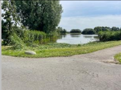
15/7, riet gemaaid, Plas van alle Winden, Naaldwijk

De eitjes in de waterbak: zijn dat geen zaadjes? Ik heb op mijn balkon raapzaad staan, en de rijpe zaden vind ik ook overal. Of beter: de tortelduifjes vinden ze overal, ze zoeken het hele balkon er voor af, Aukje Gjaltema