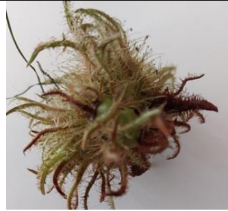
15/7, hazelnooten vallen nu uit de boom., Bogotalaan, Delft, Lia Claus