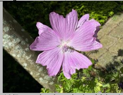
16/7, muskuskaasjeskruid (malva), Delfgauw, Bart Hendriks