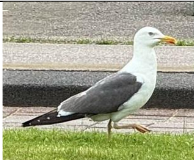
16/7, mantelmeeuw (larus), Delfgauw, Bart Hendriks