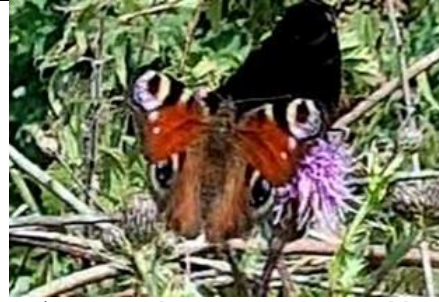
19/7, ca 40 dagpauwogen op akkerdistel in hakhout Abtswoude 52, Delft, Huub van 't Hart. Gebied in onderhoud bij Natuurlijk Delfland in opdracht van Agrarische Natuurvereniging Vockestaert