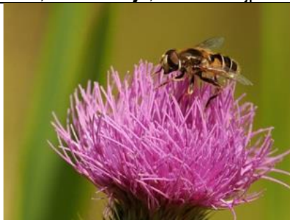
28/6, puntbijvleg , Michel Kuijpers