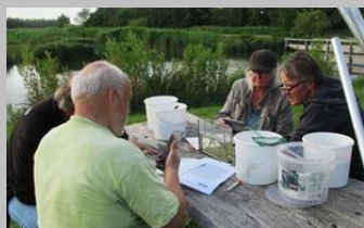
team vissen in actie

In de Riouwstraat – bij mij beneden onder het balkon- lopen nog steeds 2 nijlganzen . Nu geen 9 maar slechts 7 jongen om voor te zorgen.