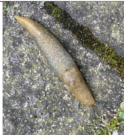
4/7, in mijn tuin vandaag, een lichte aardslak , rode lijst en zeldzaam, Aad van Uffelen