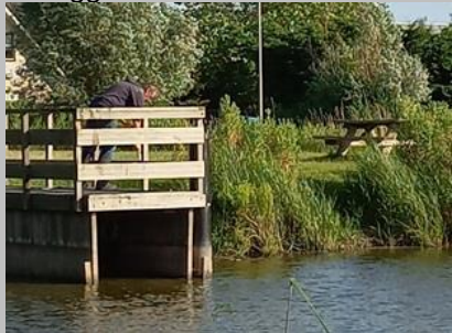
één van de gatén