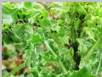
ook gevleugelde luizen