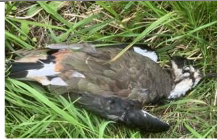
5/7, tijdens de opening van de "bomenwand" werd deze kievit door een roofvogel uit de lucht geslagen en maakte een "snoekduik", Bruun van der Seuijt