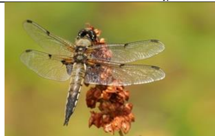
28/6, viervlek , Michel Kuijpers