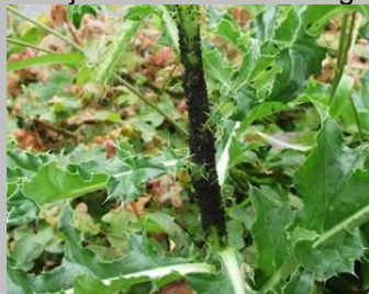
Zwart van de luizen

Dinsdagochtend heb ik die plant – akkerdistels bij het benzinstation in Delfgauw - gefotografeerd en bij nadere beschouwing van de foto's zag ik ook gevleugelde exemplaren !