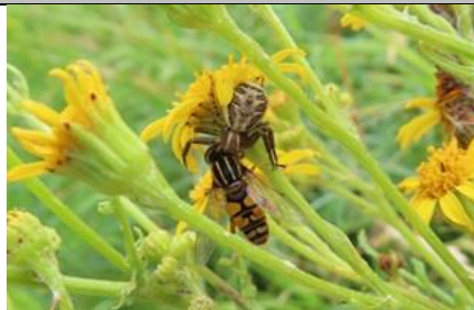
3/7, gewone pendelvlieg gevangen door krabspin , Den Hoorn, Willemein

Het Soort van het seizoen is één van de activiteiten in ons jaarthema Schoner water, klik hier voor de informatiebrief.