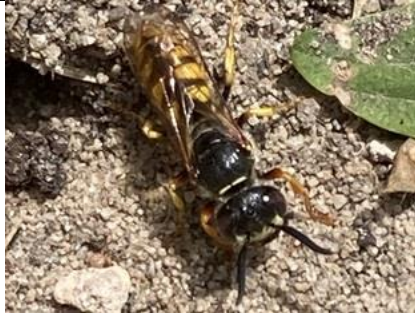
30/6, bijenwolfgraafwesp , Keizershof, Pijnacker, Betty Verheul