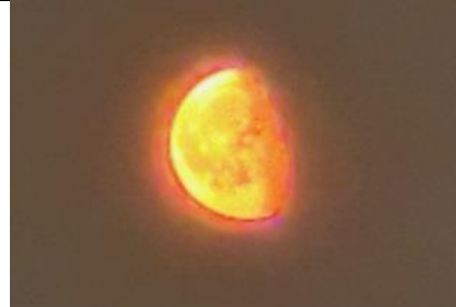
2/7, rode maan (nachtperiode) , Delfgauw, Bart Hendiks