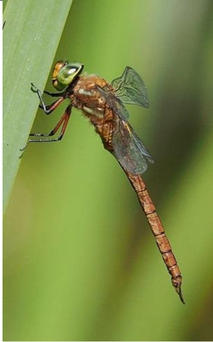
28/6, vroege glazenmaker , Michel Kuijpers