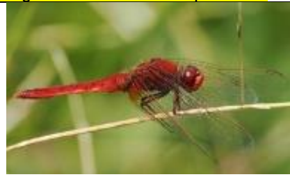
28/6, vuurlibel , Michel Kuijpers