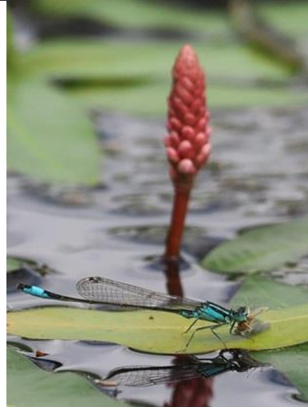
28/6, lantaarntje met haft , Michel Kuijpers