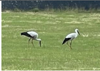
4/7, twee ooievaars bij elkaar op de Schimmelpenninck van de Oyeweg, Delfgauw, Karin Flier