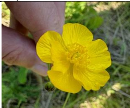
2/7, boterbloem , Delfgauw, Bart Hendiks