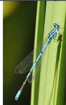
28/6, azuurwaterjuffer , Abtswoudse bos, Michel Kuijpers