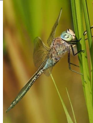
28/6, zuidelijke keizerlibel , Abtswoudse bos, Michel Kuijpers