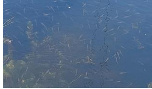
25/5, heel veel stekelbaarsjes (?) en waterpest . Vrouw Jutteland, Delft, Lia Claus