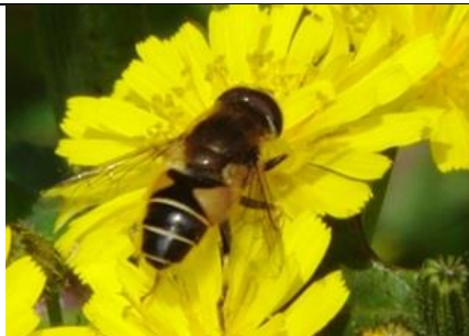
20/6, puntbijvlieg , Aukje Gjaltema