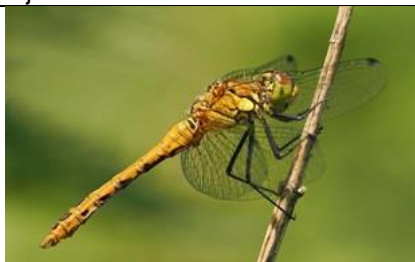
28/6, bloedrode heidelibel , Abtswoudse bos, Michel Kuijpers

Wil ik jonge meerkoetjes op de foto zetten, steekt een knobbelzwaan zijn kop ervoor. (vogels zijn soms net mensen...)