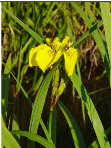
24/6, gele lis met zaad, Abtswoude, Aukje Gjaltema