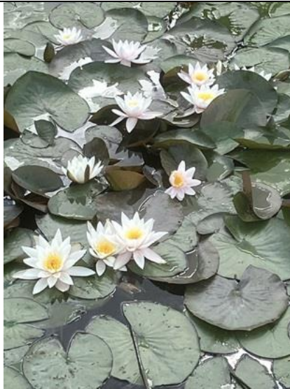
28/6, waterlelies , Dwarskade, Nootdorp, Bruun van der Steuijt