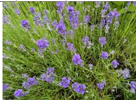
25/6, lavendel , Delfgauw, Bart Hendriks