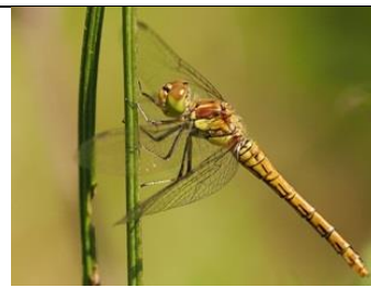
28/6, bruinrode heidelibel , Abtswoudse bos, Michel Kuijpers