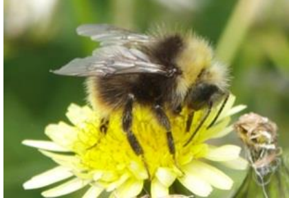
20/6, weidehommel , Aukje Gjaltema

Nb. De afspraak in de vogelwereld is dat foto's met nesten en eieren niet worden gepubliceerd om ze niet te verstoren. We zullen dus alleen de waarneming in de Nieuwsbrief opnemen.