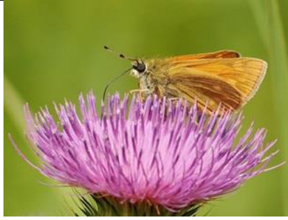
28/6, groot dikkopje , Abtswoudse bos, Michel Kuijpers