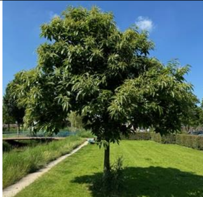
25/6, tamme kastanje , Delfgauw, Bart Hendriks