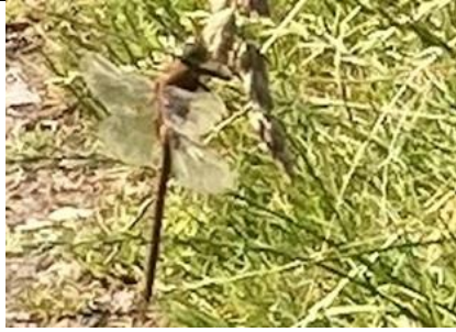
25/5, vroege glazenmaker , Balijsbos, Zoetermeer, Anneke Luijten