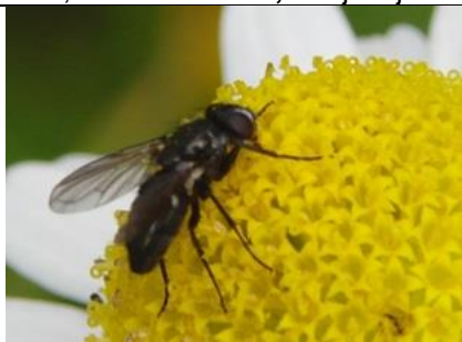
20/6, gewone pissebedvlieg , Aukje Gjaltema