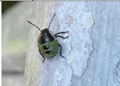
29/6, groene schildwants (nymf), Anneke van Swieten