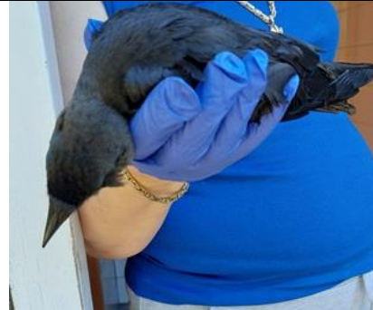
26/5, kauwtje gevonden Afrikalaan. Nog naar de opvang gebracht maar dat mocht niet baten. Lia Claus