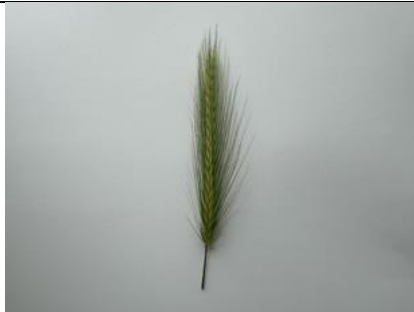
11/6, kruipertje (Hordeum), Delfgauw, Bart Hendriks

11/6, Dirk Costerplein, Dleft, Freek Boon Een hele strook grond ontdaan van alles wat spontaan opkwam: dag biodiversiteit..... Hopelijk gaat er nog wel iets geplant worden, nu ziet het er eco-treurig uit.