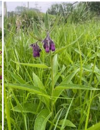
Langs de sloot bij de entree