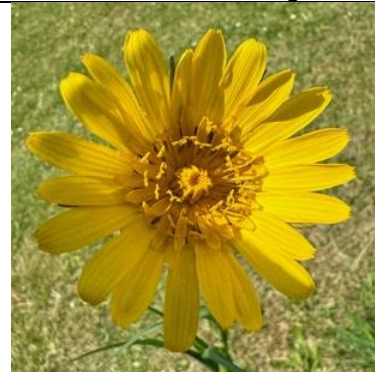
11/6, Oosterse morgenster (tragopogon), Delfgauw, Bart Hendriks