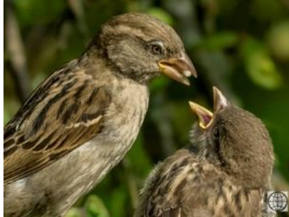
11/6, mussen , Peter Oeij 😊 de mussen worden gevoed in de tuin.

Een paartje grote bonte specht is bezig om nieuwe huisvesting uit te hakken in de wilg.