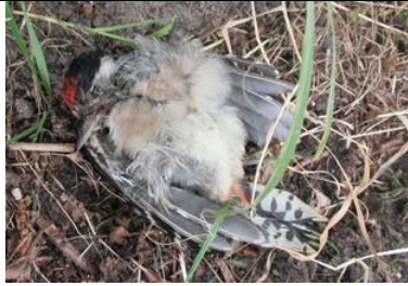
grote bonte specht