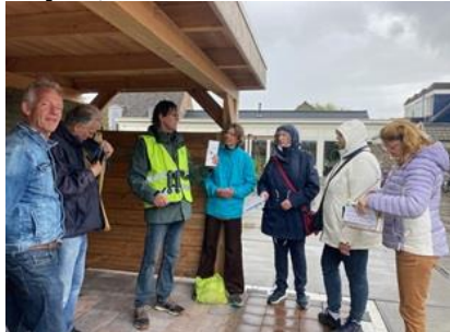
Deelnemers excursie

12 juni, excursie huismussen onder leiding van Aad van Uffelen