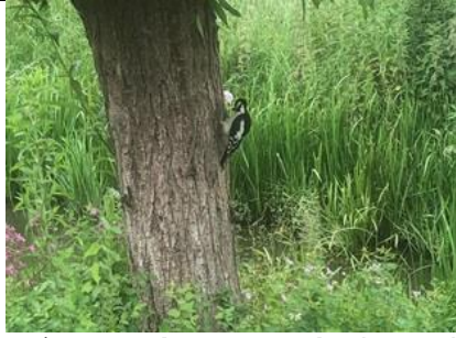
11/6, grote bonte specht , Lange Kleiweg, Rijswijk, Jolande Sluyter

Een paartje grote bonte specht is bezig om nieuwe huisvesting uit te hakken in de wilg.