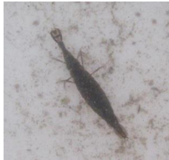
larve van gegroeftde haarwaterroofkever

Op het Van Weerden Poelmanpad zijn veel soorten in bloei te zien. Teunisbloem, vijfvingerkruid, kruldistel, jakobskruiskruid, liguster, vlasbekje – nu aan beide kanten van het fietspad – knoopkruid, avondkoekoeksbloem, blaassilene, liggende klaver, beemdoeivaarsbek, bijvoet, luzerne, kruldistel, krulzuring, biggenkruid, klaproos, rolklaver , ook nog 1 exemplaar van de spanse weglak .