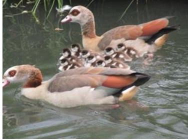
nijlganzen met jongen

Tot slot meld ik het uitkomen van eieren van de nijlgans : er zijn negen jonge gansjes die zwemmen in de vaart tussen Madoerastraat en Riouwstraat ; ze lopen over het gras, vergezeld van hun ouders. Niet alle eieren zijn uitgekomen.