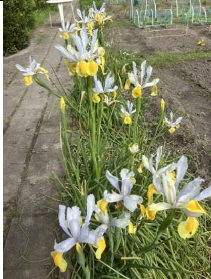
30/4, Kindertuin De Boterbloem, Delft, Bruun van der Steuijt