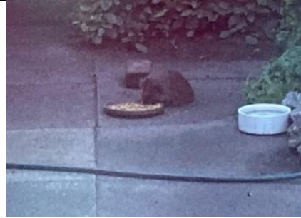
4/5, iedere avond rond kwart over 9 komt het egeltje even langs. Z'n buik vol eten, even drinken en dan zie je hem niet meer, Anneke van Swieten