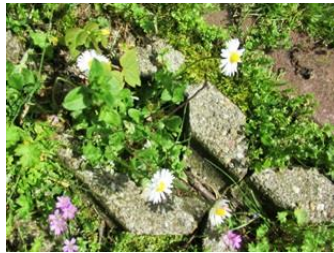
madeliefje en reigersbek