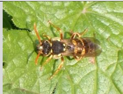
2/5, smalbandwespbij , Wezeltuin, Marian Barendtszen