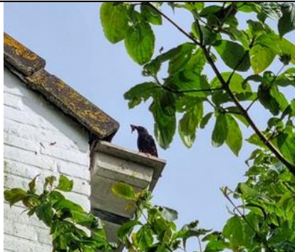
4/5, spreeuw met wormen op dakrand bij het nest met vier (?) jongen, Kwarteltuin, Delft, Huub van 't Hart.

Bij acties rond na-isolatie voor dak- en muurbroeders worden wel de vleermuis, gierzwaluw en huismus genoemd, maar niet de spreeuw. Wel doen vanwege afname broedpopulatie vanaf 1990 met 60%. Staat van instandhouding zeer ongunstig. Bron: Sovon.