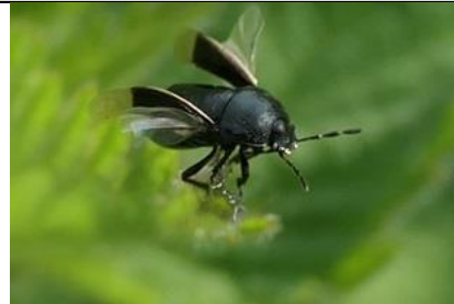
1/5, kleefkruidgraafwants , boomgaard De Kandelaar, Willemein