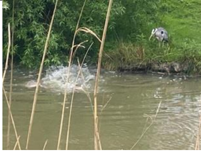
3/5, maatje te groot: paaiende karpers , ecozone Kristalweg, Delft, Gé Kleijweg