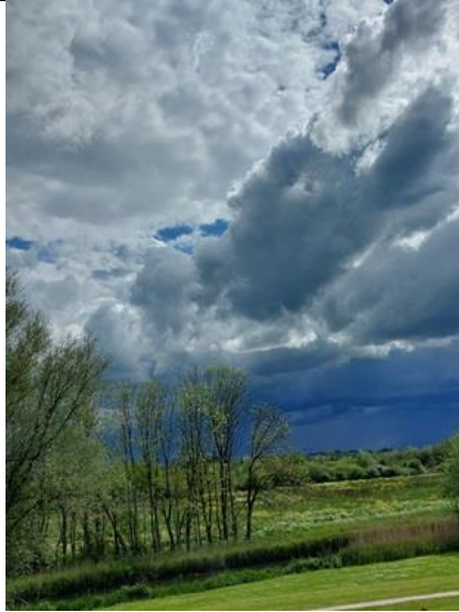
4/5, dreigende onweersbui Tanthof richting Vlaardingen, Lia Claus