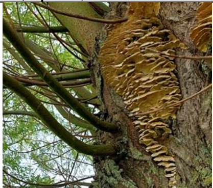
1/5, elfenbankjes op een wilg , St. Maartensrechtpad, Tanthof, Delft, Lia Claus