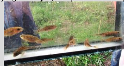
stekelebaarzen en zeeltjes

Hier vingten we vooral veel tiendoornige stekelbaarzen en kleine modderkruipers . Daarnaast jonge zeeltjes , een juveniel snoekje en weer een exoot de marm grondel .