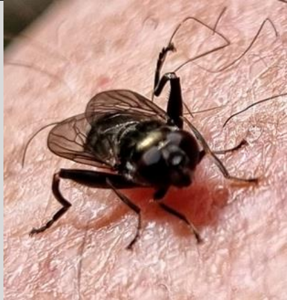
4/5, korte bladloper op bovenbeen waarnemer, Kwarteltuin, Delft, Huub van 't Hart.