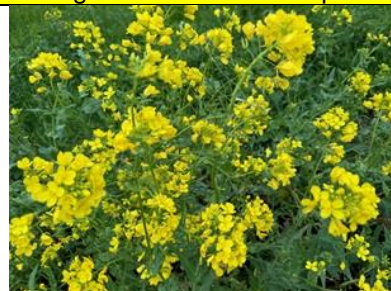
30/4, raapzaad , Delfgauw, Bart Hendriks