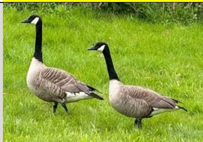
30/4, grote Canadese gans , Delfgauw, Bart Hendriks

Nb. De afspraak in de vogelwereld is dat foto's met nesten en eieren niet worden gepubliceerd om ze niet te verstoren. We zullen dus alleen de waarneming in de Nieuwsbrief opnemen.