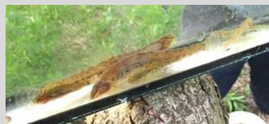
marm grondels en kleine modderkruipers

Daarna hebben we nog een tweede ronde geschept in de sloot tegen de spoordijk Delft-Schiedam. Hier vingten we naast een enorme hoeveelheid rivierkreeften ook weer veel kleine modderkruipers , enkele rietvoorns en ook weer de exotische marm grondel . Als bijvangst hadden we ook 4 kleine watersalamanders . Bij elkaar toch weer 6 soorten. Frank Herfs.