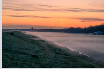
4/5, zonsopkomst bij Watergat, Monster, Danny Taheij