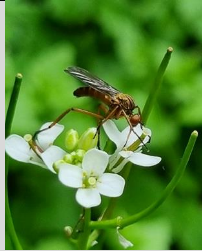
5/5, akkerdisteldansvlieg zuigt nectar van look-zonder-look, Kwarteltuin, Delft, Huub van 't Hart.