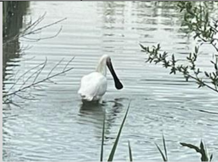
1/5, lepelaar , Karin Flier