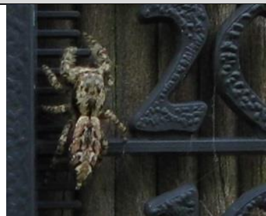
3/5, meestal zitten overdag verstopt, maar deze schorsmarpissa liet zich overdag zien en geduldig fotograferen, Aukje Gjaltema