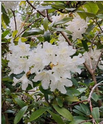
5/5, rhododendron, Botanische tuin, Delft, Lia Claus

22/4, egel , Decimastraat, Delft, Aukje Gjaltema