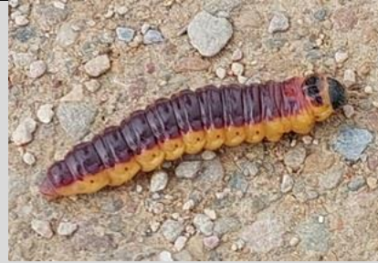
30/4, wilgenhoutrups , Abtswoudse Boa, Delft, Lia Claus