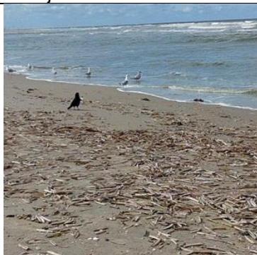
26/4, scheermessen schelpen in grote hoeveelheden angespoeld. De kraaien en meeuwen deden zich te goed, Kijkduin, Suiderstrand, Lia Claus

webcam. Inmiddels zijn ook de souterrainroosters onderaan het gebouw afgedicht met gaas, zodat de jonge valkjes op hun eerste vluchten niet in de roosters terecht komen