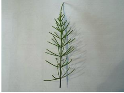
22/4, heermoes (Equisetum)- Delfgauw, Bart Hendriks