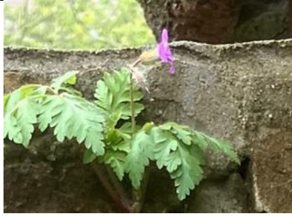
26/4, robertskruid , Ernst Casimirstraat, Delft, Bruun van der Steuijt