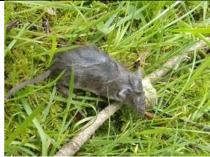
27/4, dood muisje , Voorhof, Delft, Freek Boon