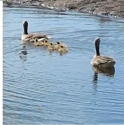
24/4, nijlganzen met 5 pijltjes, Kerkpolderweg, Delft, Lia Claus