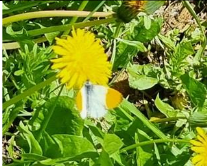
23/4, oranjetipje op paardenbloem spec, Huub van 't Hart