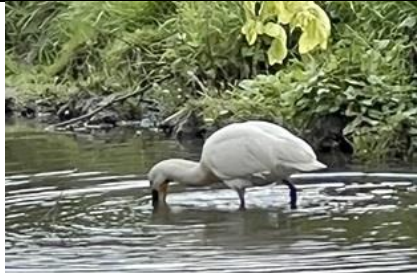
27/4, lepelaar , bij het kerkje in het Woud, Aad van Uffelen