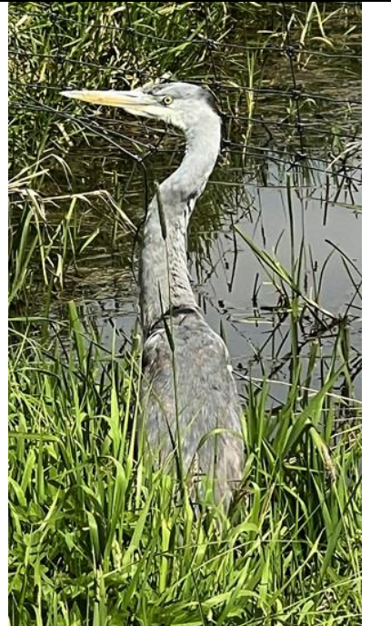
28/4, langs het Hodenpijlse pad deze blauwe reiger die mij strak bleef aankijken, Aad van Uffelen

26 april , broedende meerkoet , Drogerij, Den Hoorn, J van Geenen Na enkele jaren van broeden op niet uitgekomen eieren, dit jaar één uitgekomen ei. Moeder blijft doorbroeden.