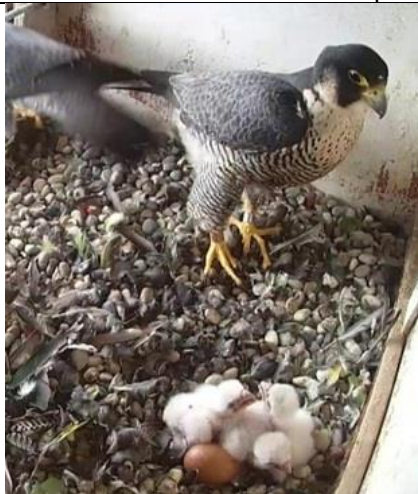
25/4, slechtvalk met jongen, TU Delft, Henk Drevijn

Afwisseling van de wacht bij slechtvalk in onze kast bij de TUD Bouwkunde Vrouwetje slechtvalk wisselt mannetje af. Drie van de vier eieren zijn al uit. Zie de foto van de