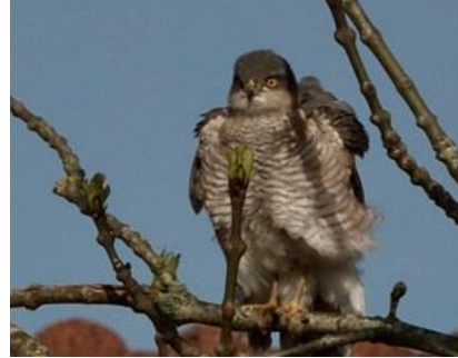
22/4, sperwer man , Kuifeendhof, Delft, Bernadette Stofregen