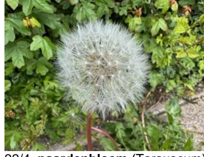
22/4, paardenbloem (Taraxacum), Delfgauw, Bart Hendiks