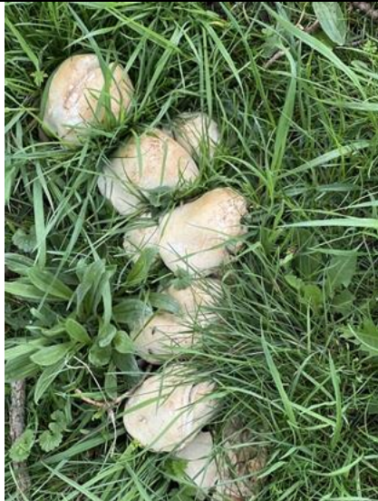
28/4, pronkridder , stond in een grote cirkel, Zuidbuurt, Maasland, Aad van Uffelen