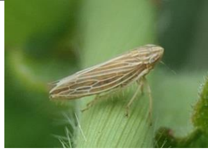
27/4, dwergcicade ( Mocytia crocea ) op riet , Rijswijk, Willemein "Vrij algemeen" zegt waarneming.nl, maar er zijn toch maar 153 waarnemingen gemeld