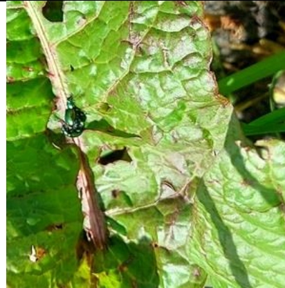
24/4, ridderzuring met bladspruitkever , Hoefslagpad Kerkpolder, Delft, Lia Claus