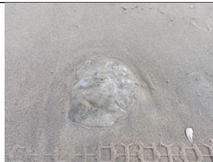
26/4, ook erg veel oorkwallen angespoeld, Kijkduin, Suiderstrand, Lia Claus