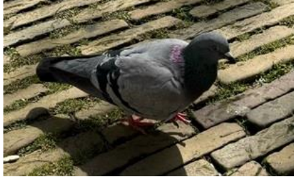
22/4, stadsduif (Columba), Delft centrum, Bart Hendriks