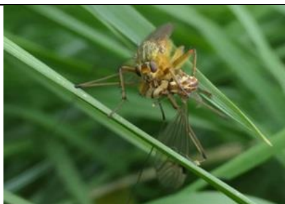
18/4, strontvlieg eet langpootmug , Den Hoorn, Willemein