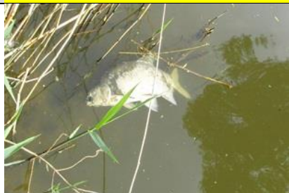
10/4, dode brasems , Delft, Aukje Gjaltema

Nb. De afspraak in de vogelwereld is dat foto's met nesten en eieren niet worden gepubliceerd om ze niet te verstoren. We zullen dus alleen de waarneming in de Nieuwsbrief opnemen.