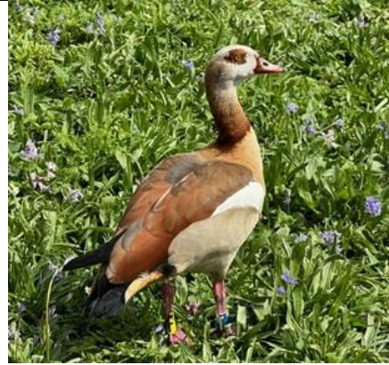
16/4, nijlgans (Alopochen), Oostpoort, Delft, Bart Hendiks