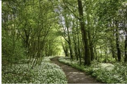
19/4, lente in het krekengebied, Frans Coppens