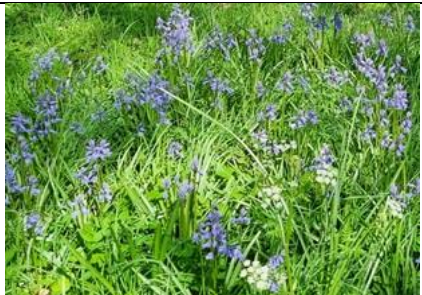
21/4, boshyacint spec langs de Thijsseweg, TUD Campus Zuid, Huub van 't Hart