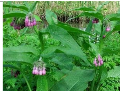
17/4, smeerwortel , Kenenburgerpad, Tanthof, Lia Claus