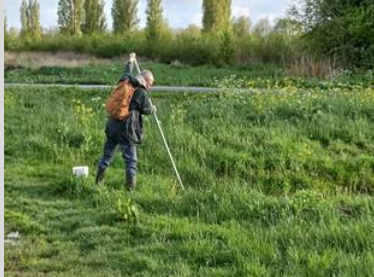
Merijn: scheppend werk

Als eerste is het Team Vissen gaan scheppen in de sloten rondom het Melarium met een groepje van vijf personen. We vingden in grote aantallen exoten, de marmelgrondel . Daarnaast ook enkele inheemse soorten, baarzen , kolblei , zeelt , tiendoornige stekelbaars en kleine modderkruiper .