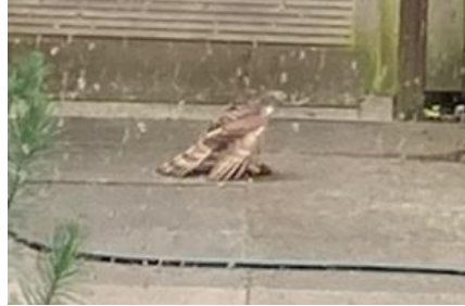
20/4, voor het eerst een sperwer in de tuin. Het was niet te zien wat hij gevangen had, een muis of een mus. Hij bleef even rond kijken en vloog toen met prooi en al weg, Anneke van Swieten