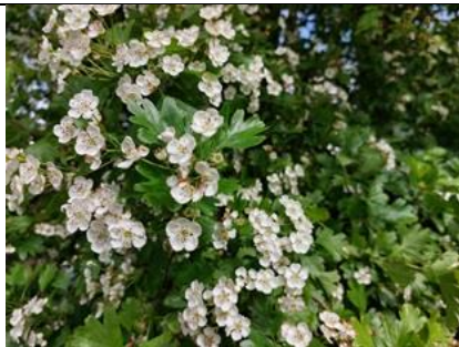
17/4, meidoorn , Kenenburgerpad, Tanthof, Lia Claus

Fazantenpaar bezig met nestbouw op Boomgaard Veelust. Ze kiezen voor een plek direct naast de bijenstal. Lekker beschermd!