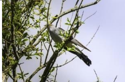
19/4, lente in het krekengebied, Frans Coppens