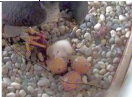
21/4, slechtvalkkuiken , TUD Bouwkunde, Delft