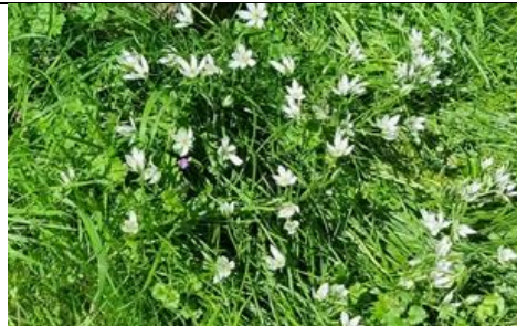
21/4, gewone vogelmelk langs de Thijsseweg, TUD Campus Zuid, Huub van 't Hart