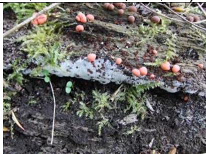
14/4, boomwrat, wimperzwammetjes, gewoon ijsvingertje, myxomyceetje , Abtswoudse Bos Midden, Delft, Aukje Gjaltema

Ik heb in de afgelopen weken al minstens 6x dode grote brasems hier in de grachten zien drijven. Omdat ze niet perse op dezelfde plek blijven liggen, is het een beetje moeilijk om ze te tellen, maar het zijn er minstens 3, plus nog 1 in het Abtswoudse Bos.