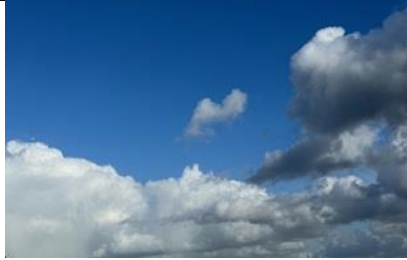
16/4, wolken na de storm, Delfgauw, Bart Hendiks