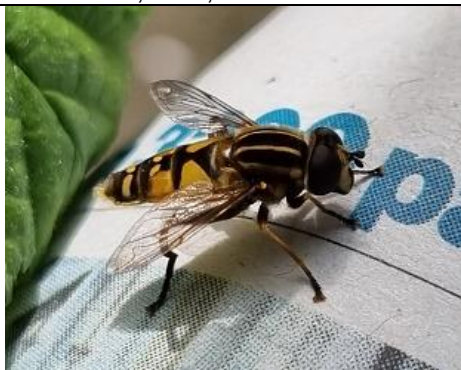
13/4, gewone pendelvlieg , Kwarteltuin, Delft, Huub van 't Hart.