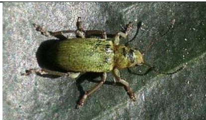
10/4, excoot pachyrhinus lethierryi , Den Hoorn, Willemein