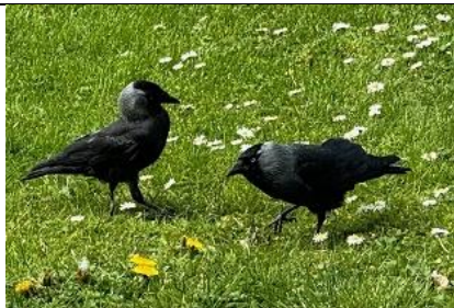
10/4, kauwen (coloeus), Delfgauw, Bart Hendriks