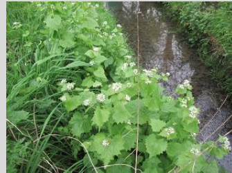
look zonder look

De look zonder look heb ik op de Noordeindseweg gefotografeerd [had hem nog niet langs de A13 gezien] en daar heb ik ook een mooie volop bloeiende dotterbloem gezien, robertskruid en schijnaardbei voltooien de doorgestuurde plantenwereld.