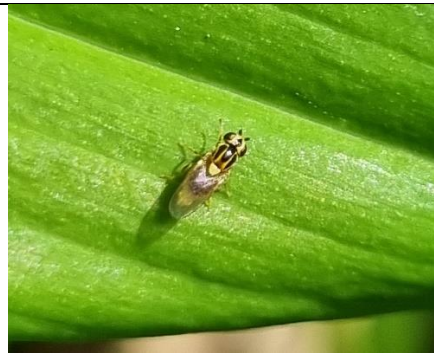
13/4, Thaumatomya notata (> 100 ex), Kwarteltuin, Delft, Huub van 't Hart.