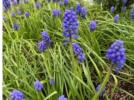
10/4, druifhyacint (muscari), Delfgauw, Bart Hendriks