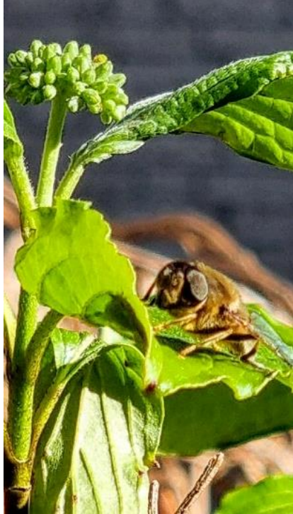
8/4, kegelbijvlieg , Kwarteltuin, Delft, Huub van 't Hart.

Nb. De afspraak in de vogelwereld is dat foto's met nesten en eieren niet worden gepubliceerd om ze niet te verstoren. We zullen dus alleen de waarneming in de Nieuwsbrief opnemen.