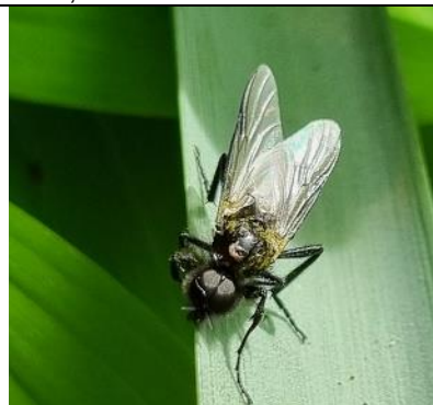
13/4, rouwvlieg , Kwarteltuin, Delft, Huub van 't Hart