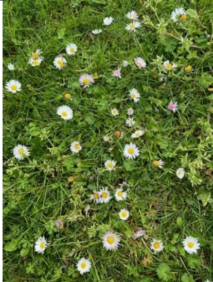
12/4, madeliefjes ( Bellis perennis ), Delfgauw, Bart Hendriks