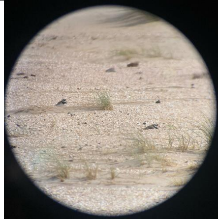
12/4, op de Zandmotor is een gebied afgezet en nu zijn binnen die afrostering twee bontbekplevieren gesignaleerd, Marius van der Flier