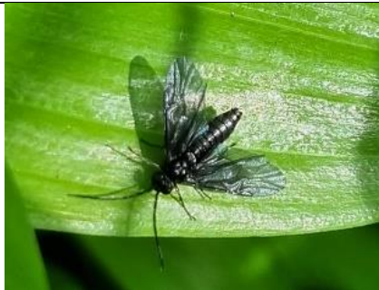
13/4, salomonszegelbladwesp (4 ex), Kwarteltuin, Delft, Huub van 't Hart