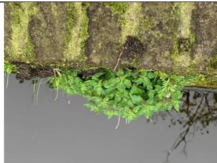
12/4, klein glaskruid , grachtmuur Oude Delft thv nr 89, Delft, Margreet Hogeweg