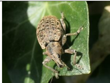
10/4, gevlekte aardsnuitkever , Den Hoorn, Willemein