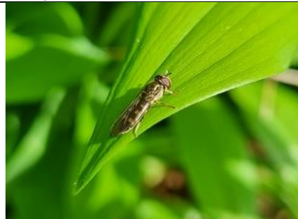
13/4, gewoon schaduwplatvoetje , Kwarteltuin, Delft, Huub van 't Hart