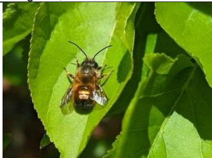
12/4, rosse metselbij geweldige bestuivers, Maarten Klein