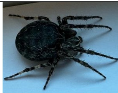
3/4, brugspin (laranioides), Delfgauw, Bart Hendriks