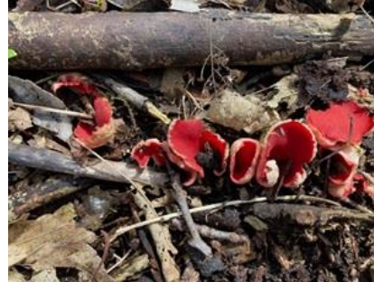
2/4, krulhaarkelkzwam in de takken rillen, Delftse Hout naast de Ikea, Anneke Luijten