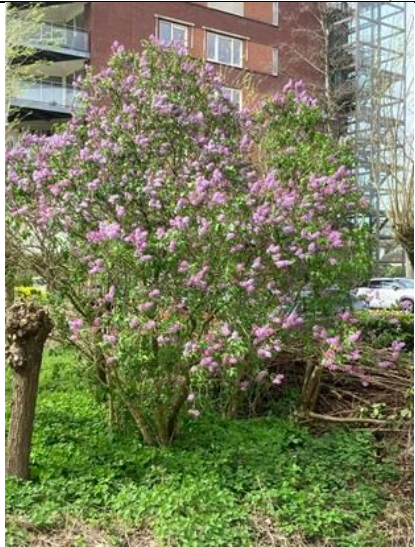
6/4, bloeiende sering , Abtswoude, Delft, Bruun van der Steuijt