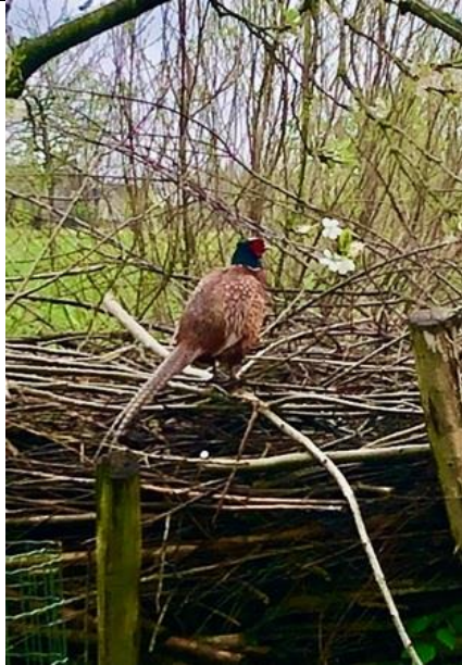
3/4, op Boomgaard Veelust was het druk met pa fazant , moe wilde eend met 10 pullen en de grote bonte specht , (Jantine Pol).