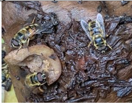
4/4, doodskopzweefvliegen , Margreet Hogeweg

Onze vochtige compostbak zit vol jonge doodskop zweefvliegen. Kunnen nog niet vliegen!