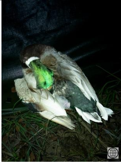
18/3, dode eend , Holysingel. Vlaardingen