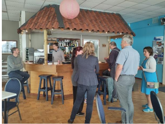
De Drassige Driehoek

Het was een zeer geslaagde bijeenkomst, er zijn de nodige informatie en ideeën uitgewisseld.