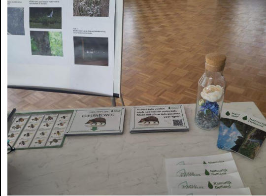
De egelbordjes trokken de aandacht