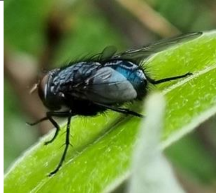
Moet zijn roodwangbromvlieg , Kwarteltuin, Huub van 't Hart.