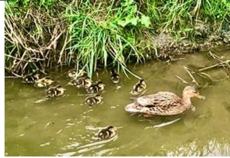
3/4, op Boomgaard Veelust was het druk met pa fazant , moe wilde eend met 10 pullen en de grote bonte specht , (Jantine Pol).