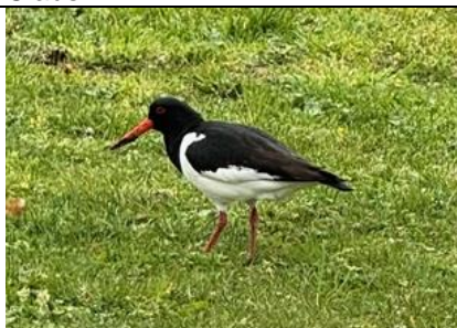
2/4, scholekster (hematopus), Delfgauw, Bart Hendriks