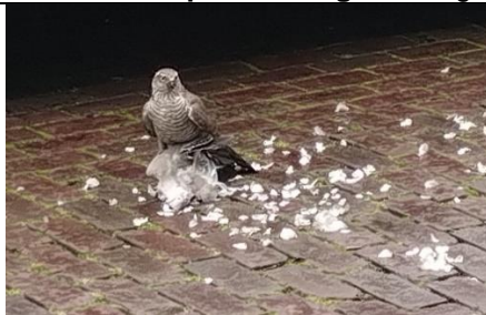
5/4, sperwer , parkeerplaats gemeentehuis Naaldwijk, Alex Koppert

Onze vochtige compostbak zit vol jonge doodskop zweefvliegen. Kunnen nog niet vliegen!