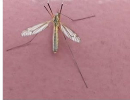
6/4, lentelangpootmug op de buitendeur, Aziëlaan, Delft, Lia Claus