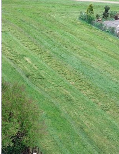
2/4, gras gemaaid door gemeente. Ik dacht dat ze dat zouden minderen?, Aziëlaan, Delft, Lia Claus