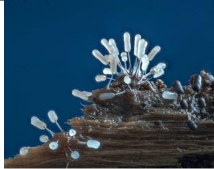
31/3, Stemonitopsis sp., Lage Bergse Bos, Hans Peters

31/3, citroenvlinder . Kwarteltuin, Delft, Huub van 't Hart