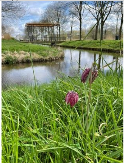
29/3, wilde kievitsbloem , 3 ex., Abtswoudsepark, Foto Ivo Slaghekke van het team Abtswoudsepark Biodivers.