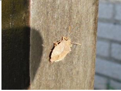
18/3, snuitkeverschildwants , Syriësingel, Delft, Aukje Gjaltema

Zomaar in het zonnetje op het bankje voor mijn huis: een snuitkeverschildwants. Een eersteling :-)