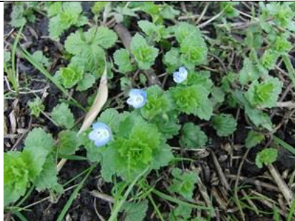
25/3, grote ereprijs , Delft, Aukje Gjaltema

De eerste meidoorns bloeien al. In maart! Verder paarse, witte en gele dovenetel, hondsdrif, grote ereprijs , de eerste tulpen, blauwe druifjes en nog heel wat meer. De wilgen en noorse esdoorns staan ook in bloei, fijn voor de insecten, ik zie er alleen nauwelijks bijen of hommels op. Hopelijk komt dat nog.