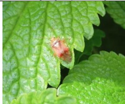
29/3, weideschaduwants op citroenmelisse , Den Hoorn, Willemein