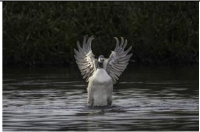
28/3, Hiep, Hiep, Hoera, lente !!, Frans Coppens

Totaal 23 dode bruine kikkers in onze tuin geteld. En ineens toch 1 (levende) kikker en drill in de vijver. En later nog 4 kikkers. Toch een paar overleefd of ze komen ergens anders vandaan.