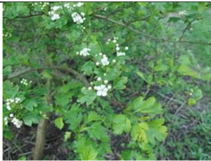
23/3, meidoorn , Delft, Aukje Gjaltema

De eerste meidoorns bloeien al. In maart! Verder paarse, witte en gele dovenetel, hondsdrif, grote ereprijs , de eerste tulpen, blauwe druifjes en nog heel wat meer. De wilgen en noorse esdoorns staan ook in bloei, fijn voor de insecten, ik zie er alleen nauwelijks bijen of hommels op. Hopelijk komt dat nog.