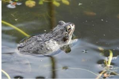
27/3, bruine kikker , Schepen, Naaldwijk, Aad van Uffelen

Totaal 23 dode bruine kikkers in onze tuin geteld. En ineens toch 1 (levende) kikker en drill in de vijver. En later nog 4 kikkers. Toch een paar overleefd of ze komen ergens anders vandaan.