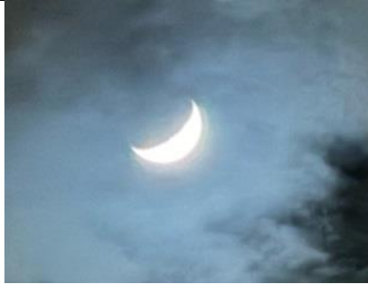
19/3, Maansikkel achter wolk, Delfgauw, Bart Hendriks

Zomaar in het zonnetje op het bankje voor mijn huis: een snuitkeverschildwants. Een eersteling :-)