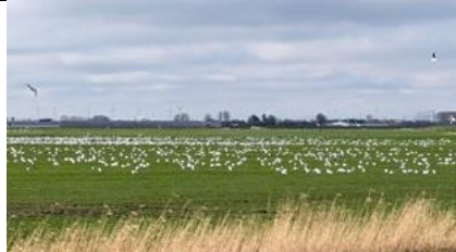
1/3, meeuwenvergadering , Woudtse polder, Willemein

Foto dd 18/3 is géén steekmug , maar 'n dansmug en die steekt niet, Anna Kreffer