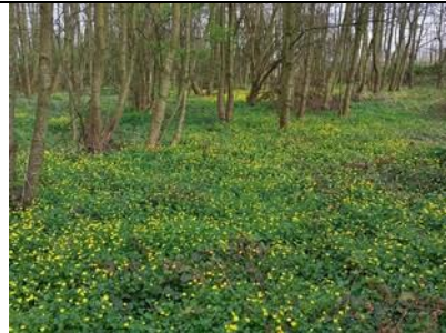
29/3, Haagwegbosje kleurt geel, Wilco Vos