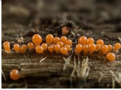
31/3, waarschijnlijk het peervormige draadwatje , Hans Peters