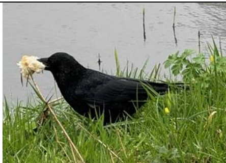
26/3, zwarte kraai met broodkruimel, Delftse Hout, Bart Hendriks