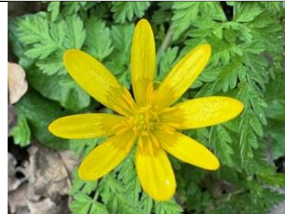
26/3, gewoon speenkruid , Delftse Hout, Bart Hendriks