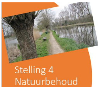
Stelling 4 Natuurbehoud