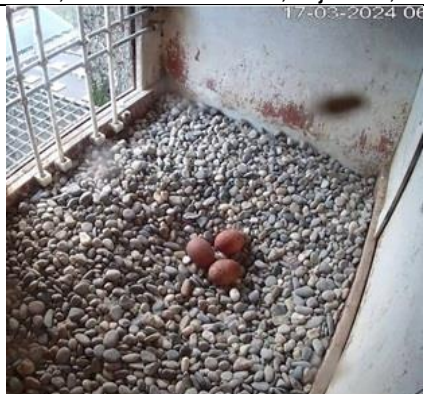
17/3, drie eieren bij de slechtvalken, watertoren, TU Delft, Henk Drevijn

En toen waren er drie eieren in onze slechtvalkkast op de watertoren van TU Bouwkunde. Daar zal het wel bij blijven. Nu hopen op een goed broedresultaat. Foto Henk Drevijn van de stills van klik hier