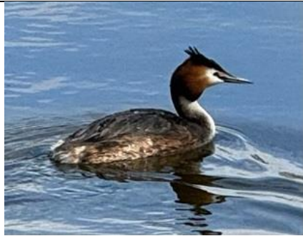
14/3, fuut, Delfgauw, Bart Hendriks