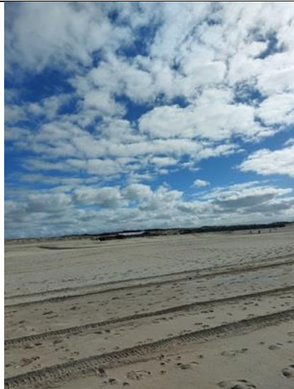
16/3, Bloemkoolwolken, Kijkduin, Lia Claus