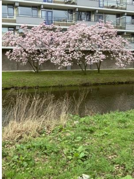
14/3, voorjaar kondigt zich aan magnolia in volle bloei, Voorhofdreef, Delft, Bruun van der Steuijt