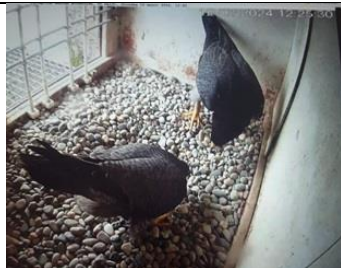
12/3, baltsende slechtvalken , watertoren TU, Delft, Henk Drevijn

Nb. De afspraak in de vogelwereld is dat foto's met nesten en eieren niet worden gepubliceerd om ze niet te verstoren. We zullen dus alleen de waarneming in de Nieuwsbrief opnemen.