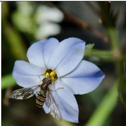
14/3, snorzweefvlieg , Maarten Klein