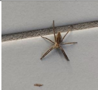
14/3, kraamwebspin in de hal beneden, Azielaan, Delft, Lia Claus