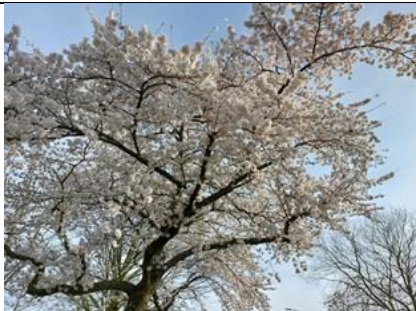
14/3, kersenbloesem , Derde Werelddreef Tanthof, Delft, Lia Claus