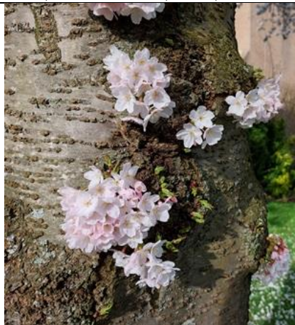
14/3, kersenbloesem op de stam, Derde Werelddreef Tanthof, Delft, Lia Claus