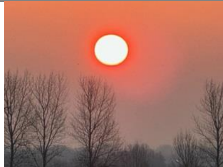
14/3, zonsopkomst 07.25u, Delfgauw, Bart Hendriks