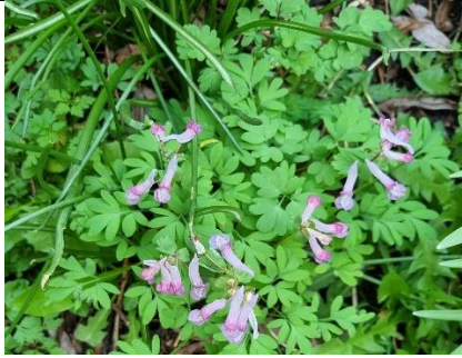
14/3, vingerhelmbloem (met handvorming ingesneden schutblaadjes), Kwarteltuin, Kwartelstraat, Delft, Huub van 't Hart