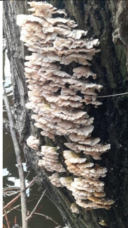
2/3, plooiwaaier , Thijssvaart, Delft, Piet Ruygok