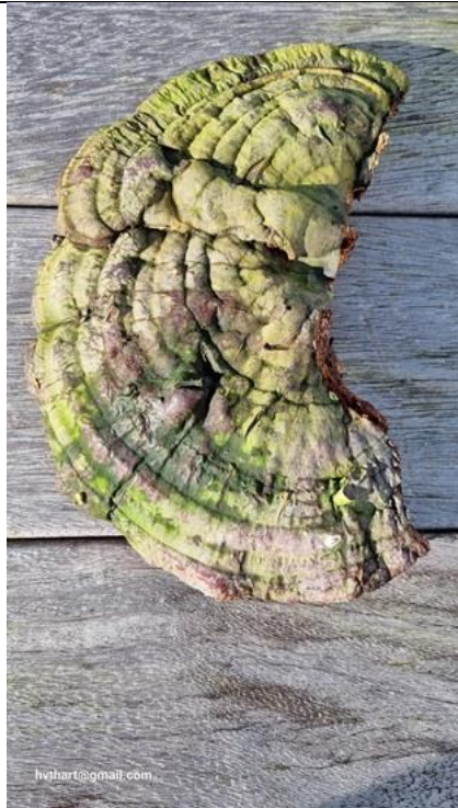
2/3, bovenkant echte tonderzwam , Thijssevaart, Delft, Huub van 't Hart