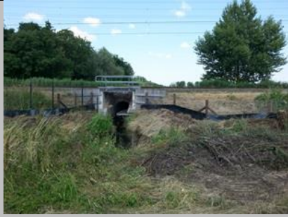
Eén van van de bestaande ecobruigen in het Abtswoudse Bos.