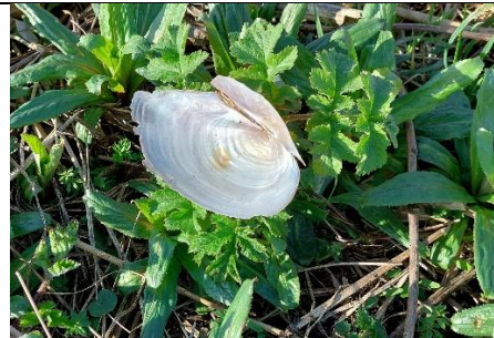
27/2, zwanenmossel , Tigrispad, Delft, Lia Claus