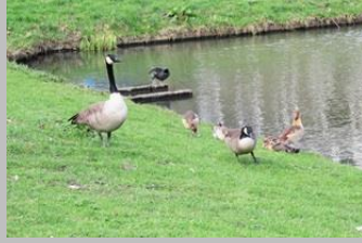
nijl- en Canadese ganzen