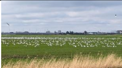
1/3, meeuwen vergadering, Woudtse polder, Willemein