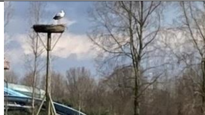
21/2, zwarte grafkorst , Jaffa begraafplaats Delft, Patrick Ehlert

Op zeker drie verschillende grafstenen in het oude gedeelte van de Jaffa begraafplaats is een korstmoss te vinden met de toepasselijke naam zwarte grafkorst . Kenmerkend voor deze soort is de blauw-met-witte rand die vooral goed zichtbaar is als het droog is