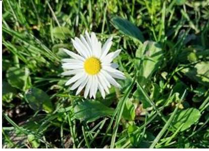
27/2, madeliefje , Tigrispad, Delft, Lia Claus