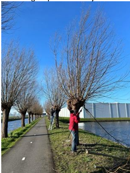
Begin van het knotten

Er zijn 24 knotters op deze zonnige ochtend aan de slag gegaan aan het Wenpad en langs het fietspad z.g. Wilgenpad, aan de rand van het Westland (zie ook volgende item hieronder). In onze groep konden wij wederom twee nieuwe, enthousiaste mensen verwelkomen.