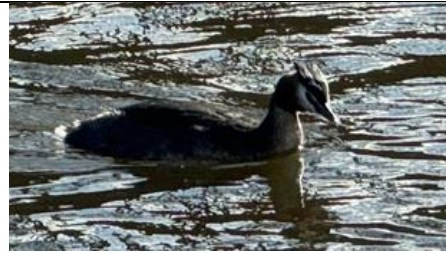
27/2, fuut , Oostpoort, Delft, Bart Hendriks