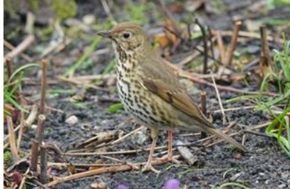
3/3, zanglijster , Aad van Uffelen De zanglijster, is weer in onze tuin gezien, een prachtige zangvogel en een genot dat hij ons elk jaar weet te vinden.

De amandelwolfsmelk is een zeer zeldzame, wintergroene plant die normaal in april en mei bloeit. Het melksap van deze plant is zéér giftig en brandt op de huid. Vermoedelijk gaat het hier om een verwilderd exemplaar.