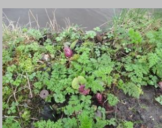
Groot hoefblad, Delftsestraatweg en in Delfgauw

De eerste bloemen van het speenkruid heb ik twee weken geleden gezien in de diepe talud naast het fietspad van de Delftsestraatweg [Delfgauw]. Een dag later ook langs het Bieslandse pad. Nu komt het vrijwel overal bloeiend voor naast mijn routes. Groot hoefblad zag ik het eerst langs de Pijnackerse Vaart [ Delfgauw] en deze week ook naast mijn vaste route langs de A13. Verder heb ik een mannotjesfazant gezien naast de Noordeindseweg en waren de 6 jonge nijlganzen goed gegroeid deze week.