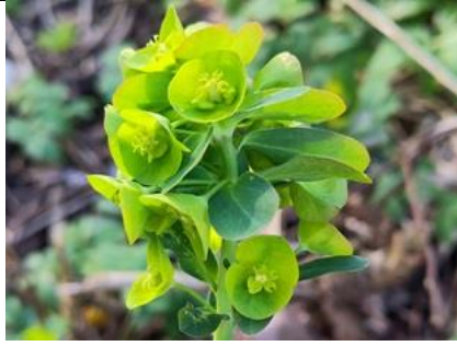
2/3, amandelwolfsmelk , Delft-Noord / Rijswijk, Patrick Ehlert

De amandelwolfsmelk is een zeer zeldzame, wintergroene plant die normaal in april en mei bloeit. Het melksap van deze plant is zéér giftig en brandt op de huid. Vermoedelijk gaat het hier om een verwilderd exemplaar.