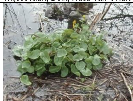
2/3, dotterbloem , Tanthofkade, Delft, Freek Boon