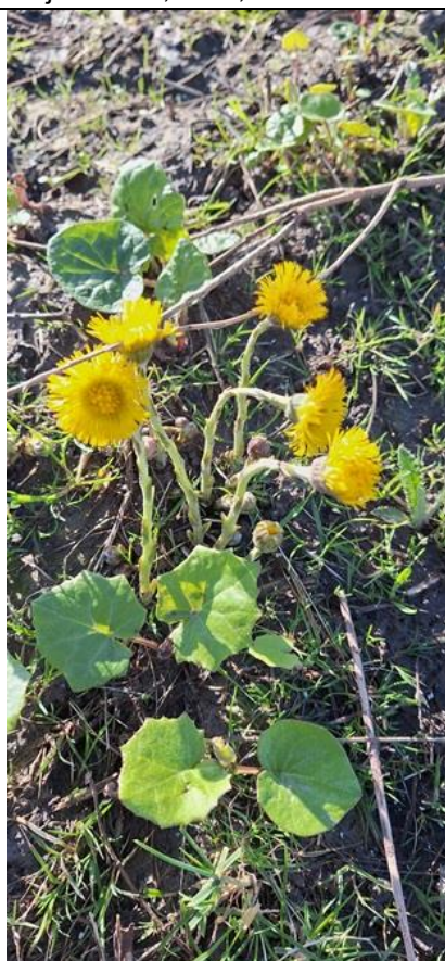
2/3, klein hoefblad , Wenpad, Poeldijk, Clazien en Ton Koene