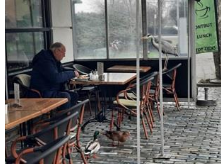
29/2, blauwe reiger eet mee in koffiehuis Het Kalf, de reiger komt 2x per dag en heet Pino, Kalverbos, Delft, Geert van Poelgeest