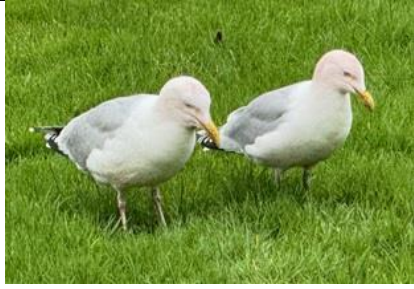
26/2, trappelen van de zilvermeeuw (argentatus), Delfgauw, Bart Hendriks