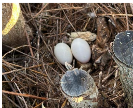
eerste wilg: nest met eieren

Het begon al goed, toen de knotter van de eerste wilg ontdekte dat er een eendennest met 2 eieren in de boom zat, dus deze boom werd verder met rust gelaten.