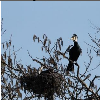
27/2, deze aalscholers hebben al jongen, Ackerdijkse Plassen, Pijnacker, Helma Vonk