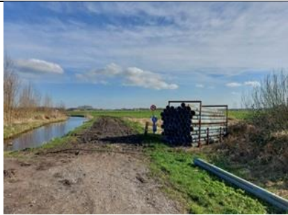
27/2, Tanthofkade wandelgebied naar Harreweg. Hekje is weg nu liggen er Buizen! Dat ziet er niet goed uit. Lia Claus