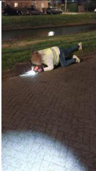
Controle van een put

Na een koude week kwam de trek rustig op gang maar niet op alle locaties.