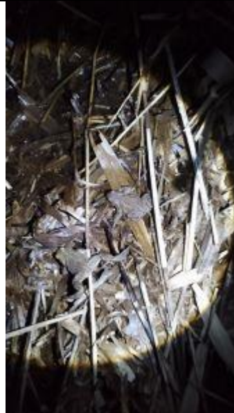
Een zoekplaatje. Dit is dus de reden waarom je niet buiten de weg moet staan bij het overzetten.