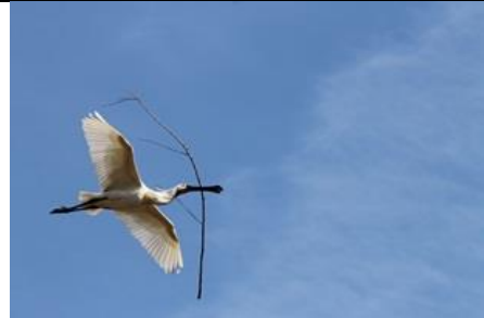
27/2, lepelaar met nestmateriaal onderweg, Delftse Hout, Delft, Helma Vonk