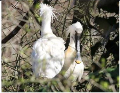
27/2, lepelaars weer terug, Delftse Hout, Delft, Helma Vonk