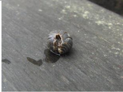
23/2, gewone oprolpissebed , Delft, Aukje Gjaltema