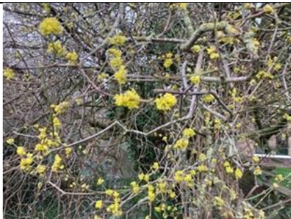
20/2, gele kornoelje , Agnetapark, Delft Anneke Luijten