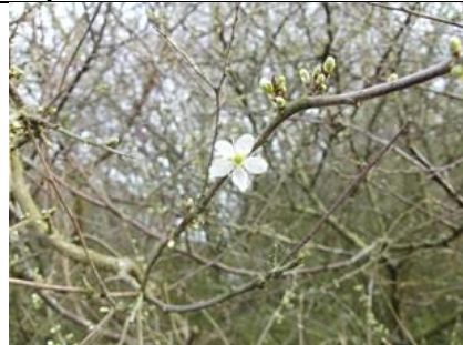
20/2, sleedoorn , Abtswoudsebos, Delft, Aukje Gjaltema