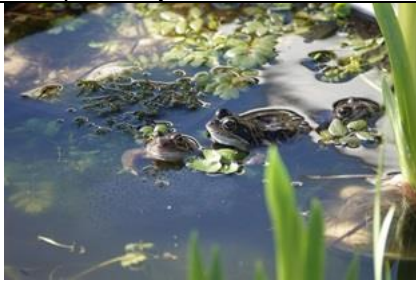
11/2 grote bastaardkikker , Aad van Uffelen

LET OP 29 FEBRUARI IS EEN SCHRIKKELDAG. Een dag voor waarnemingen die je maar één keer per vier jaar kan melden.