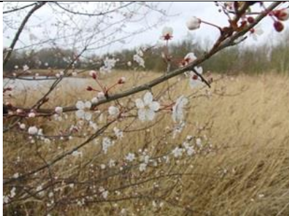
20/2, kerspruim , Abtswoudsebos, Delft, Aukje Gjaltema