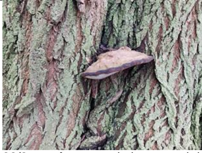
22/2, tonderzwam , kabouterpad richting Tanthof, Delft, Lia Claus