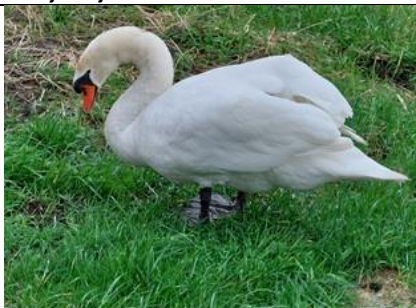
22/2, knobbelzwaan , Fiets/voetpad Windhoek, Delft, Lia Claus