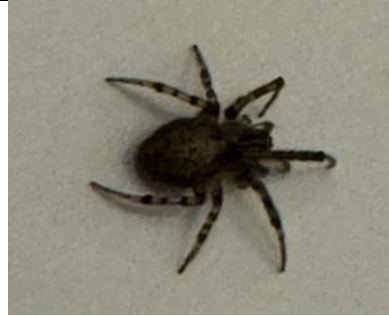
22/2, venstersectorspin , Delfgauw, Bart Hendriks