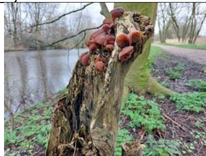
22/2, judasoor , kabouterpad richting Tanthof, Delft, Lia Claus