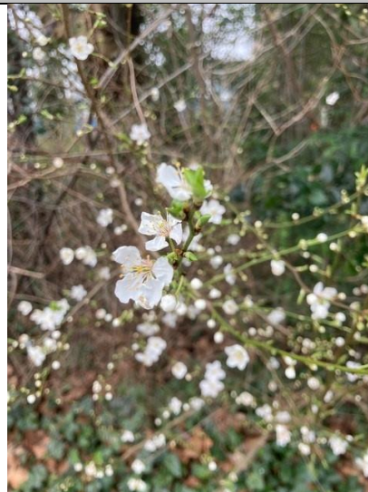
20/2, kerspruim , Agnetapark, Delft, Anneke Luijten