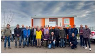
23 knotters !

met een grote groep van 23 mensen, aan de slag konden.