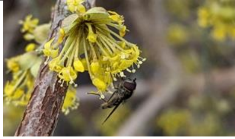
15/02, variabel elfje (op de gele kornoelje ), Rijswijk-Buiten, Maarten Klein