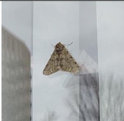
15/02, perentak , Aukje Gjaltema