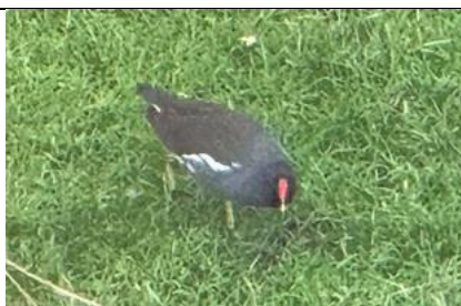
17/02, waterhoen , Delfgauw, Bart Hendriks

Dit is een erg klein paddenstoeltje van hooguit 1cm dat uitsluitend groeit op mannelijke elzenkatjes . De katjes zien er door aantasting van de schimmel verkoold (gemummificeerd) uit. Vooral in februari te vinden.