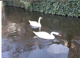
15/02, knobbelzwanen , Voldersgracht, Delft, Lia Claus