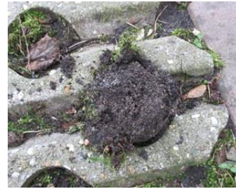
versperring voor de mol?

Vlak bij huis hebben de nijlganzen ook de lente gevierd: 6 jonge gansjes (Floresstraat). Het nest was op dezelfde plek als dat van vorig jaar (Riouwstraat), maar nu geen niet uitgekomen eierschalen. Ook de takken op de plek van het meerkoetennest in het water waren weer 'aangevuld' en er zaten twee meerkoeten bij.