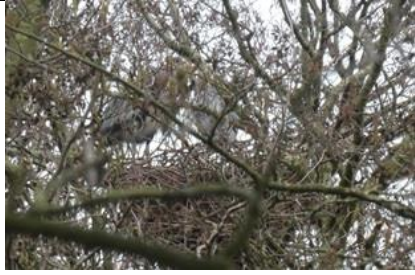
13/02, blauwe reigers op hun nest, Willemein