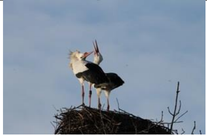
01/02, klepperende oievaarders op nest van vorig jaar, Groenzoom, Pijnacker, Helma Vonk