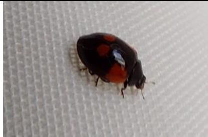
12/02, tweestippelig lieveheersbeestje in het gordijn, Tanthof West, Delft, Lia Claus