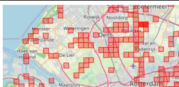
Mollen in Delfland op 20 februari 2024, na het mollenweekend.