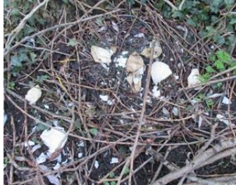
nijlgans: lege eierschalen

Vlak bij huis hebben de nijlganzen ook de lente gevierd: 6 jonge gansjes (Floresstraat). Het nest was op dezelfde plek als dat van vorig jaar (Riouwstraat), maar nu geen niet uitgekomen eierschalen. Ook de takken op de plek van het meerkoetennest in het water waren weer 'aangevuld' en er zaten twee meerkoeten bij.