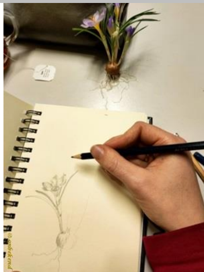
en zo ziet een krokus er uit