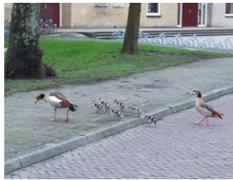
en hier 6 jonge nijlgansjes