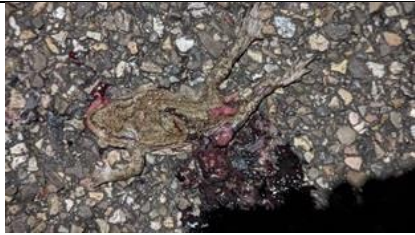
15/02, dode pad , Lookwating, Den Hoorn, Willemein Kriesels