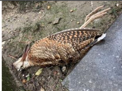
11/02, dode houtsnip , hoek Choorstraat/Voorstraat, Delft, Tineke Zwaan