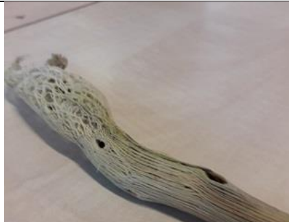
02/02, berenklauw stengel, Natuurtuin Rijswijk, Elly Herbschleb-Voogt

Nb. De afspraak in de vogelwereld is dat foto's met nesten en eieren niet worden gepubliceerd om ze niet te verstoren. We zullen dus alleen de waarneming in de Nieuwsbrief opnemen.