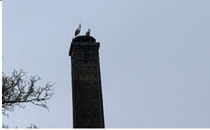
05/02, ooievaars , Weteringlaan, Delft, Margreet Hogeweg

Een ooievaarspaar kleppert af en toe op de schoorsteen naast het Sportfondsenbad aan de Weteringlaan. Weer teruggekeerd, net zoals vorig jaar.