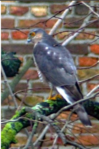
07/02, sperwer , NH kerk, Maasland, Thérèse Zwaard,

Vandaag, 7 februari om ca. 11.00 waren twee eksters nogal druk in de boom bij de toren van de NH kerk in Maasland. Ze probeerden deze sperwer weg te jagen, maar de sperwer was niet echt onder de indruk (de foto is gemaakt door het dubbelglas, dus niet echt mooi scherp).