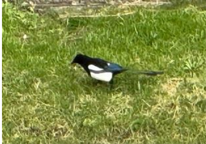
06/02, ekster (pica pica), Delfgauw, Bart Hendriks

Een ooievaarspaar kleppert af en toe op de schoorsteen naast het Sportfondsenbad aan de Weteringlaan. Weer teruggekeerd, net zoals vorig jaar.