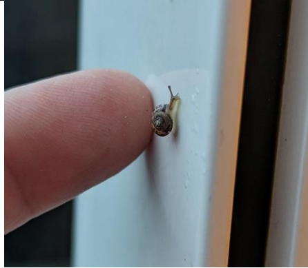
07/02, minuscuul baby-slakje, tuin in Rijswijk, Maarten Klein