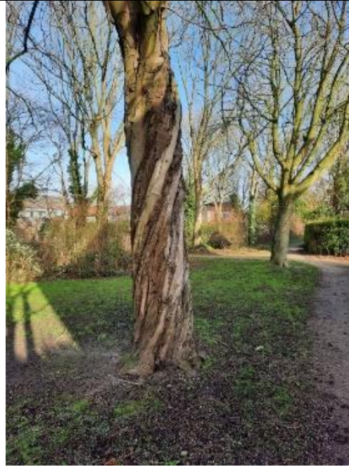
Een karakteristieke draaiing in de stam van een paardenkastanje , Geert