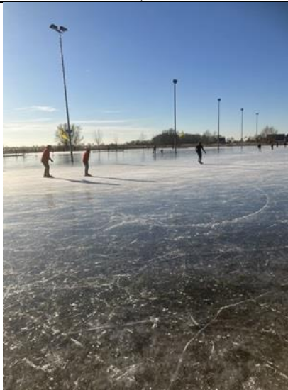
10/01, schaatsbaan Schipluiden, Bruun van der Steuijt

Bijzonder. Bij de sleedoorn komt eerst de bloem en daarna het blad. De meidoorn bloeit daarna en komt met bloempjes met blad vrijwel tegelijk. Deze knoppen zaten echter aan de meidoorn en ik zie geen blad.