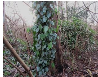
klimop tegen boom

En op het ILSY-plantsoen zelf de naderende lente ? Clematis in knop en stinkende gouwe op diverse plekken aan de rand van de bestrating als begin van de nieuwe bloei, maar uiteraard nog niet bloeiend.