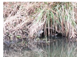
waterhoentjes bij rioolbuis