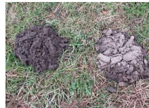
twee kleuren molshopen