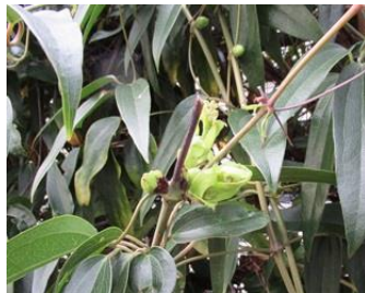
clematis in de knop