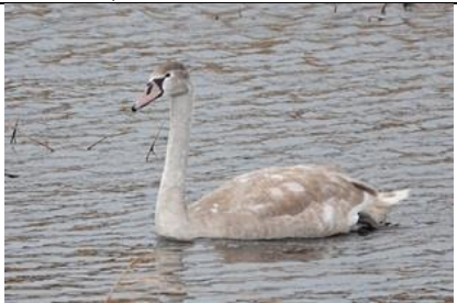
09/01, knobbelzwaan , duingebied De Banken, Monster, Aad van Uffelen