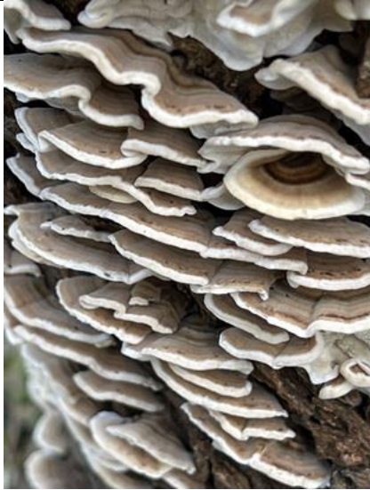
09/01, elfenbankje , duingebied De Banken, Monster, Aad van Uffelen