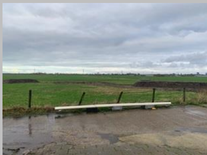
Overzicht Woudse Tuin