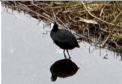
13/01, meerkoet op het ijs, Bart Hendriks