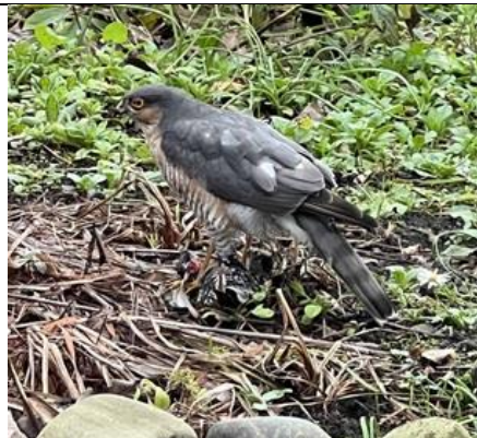
09/01, sperwer in onze tuin die een spreeuw opeet, Aad van Uffelen