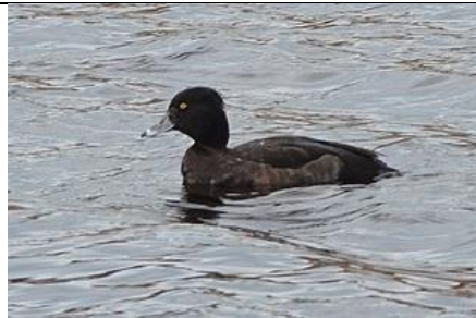
09/01, kuifeend , duingebied De Banken, Monster, Aad van Uffelen