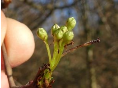
10/01, meidoornknoppen , Woudtse polder, Midden Delfland, Willemein

Bijzonder. Bij de sleedoorn komt eerst de bloem en daarna het blad. De meidoorn bloeit daarna en komt met bloempjes met blad vrijwel tegelijk. Deze knoppen zaten echter aan de meidoorn en ik zie geen blad.