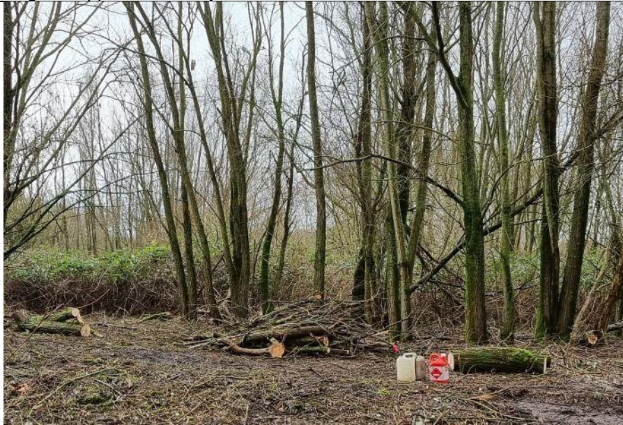
Illegaal kappen in het Thijsssebos