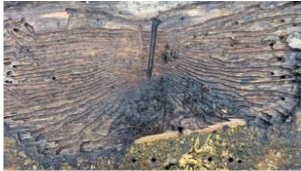
gangenstelsel van larven van de iepenspintkever