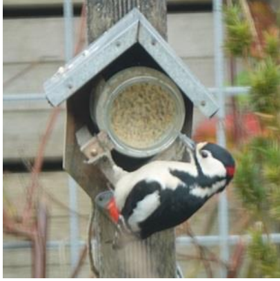
09/01, grote bonte specht komt dagelijks snoepen, Aad van Uffelen