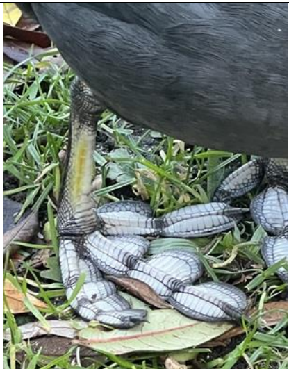
09/01, aandacht voor de sublieme voet van de waterhoen is niet verkeerd, echt bijzonder, Aad van Uffelen