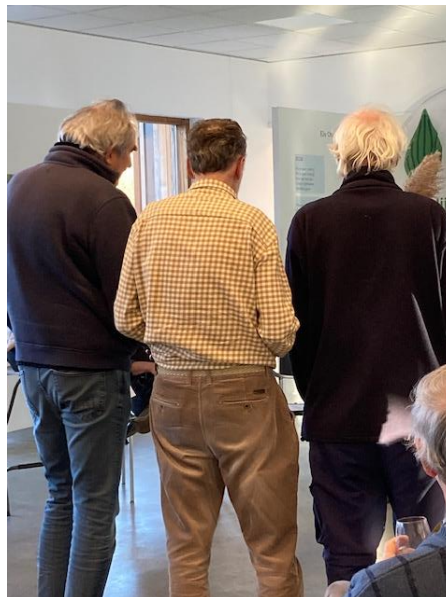
nu eens de achterzijde van het bestuur