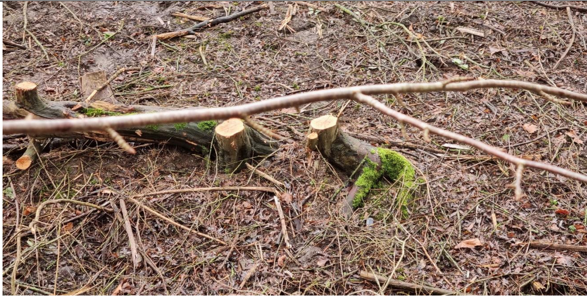
Illegaal kappen in het Thijsssebos