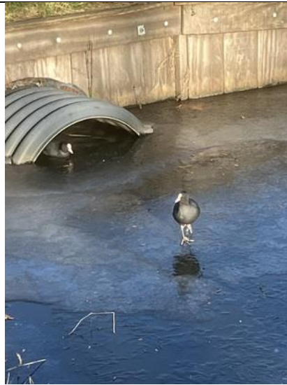
10/01, en meerkoeten vinden onderdak op Abtswoude, Bruun van der Steuijt