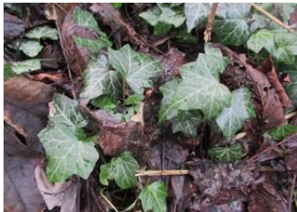
Klimop op de grond

En op het ILSY-plantsoen zelf de naderende lente ? Clematis in knop en stinkende gouwe op diverse plekken aan de rand van de bestrating als begin van de nieuwe bloei, maar uiteraard nog niet bloeiend.