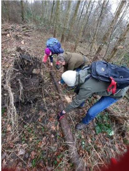
Even die boomstam omdraaien

Diverse gallen gevonden van de gewone wilgenroosjesgalmug op wilg, hazelaarrondknopmijt op hazelaar, knikkergalwesp, knoppergalwesp, en de zeldzame ramshoorngalwesp op zomereik. Ook geleedpotigen: o.a. mospissenbedden, kleipissebedden, steenlopers en platruggen. Verder o.a. een buizerd, div. huisjesslakken, naaktslakken, paddenstoelen, wormen en sporen van muizen en mollen. Willemein Poot