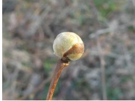
10/01, hazelaarrondknopmijt , Woudtse polder, Midden Delfland, Willemein