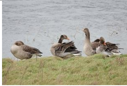
09/01, grauwe gans , duingebied De Banken, Monster, Aad van Uffelen