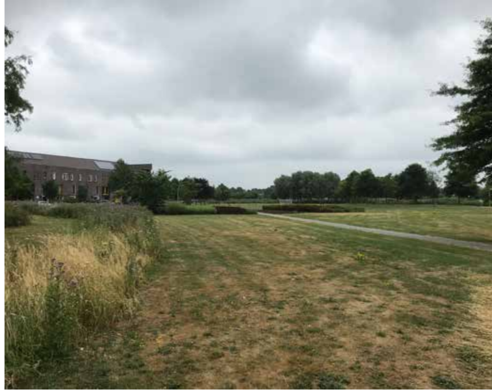
ruig groen (maaibaar bollenlint), groenvakken en voetbalveld

Het park kent verder relatief weinig andere speelmogelijkheden voor de maat die het heeft. Het groengebied aan de Bieremalaan is goed ontsloten voor diverse verkeersstromen. Door deze positie zou het groengebied aan de Bieremalaan niet alleen een functie kunnen hebben voor de direct omwonenden uit de buurt, maar ook voor de hele wijk. De toevoeging van inclusief spelen en een waterspeelplek zal een verrijking voor de wijk zijn.