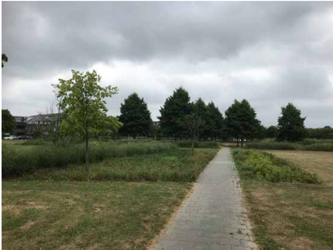
pad (lange lijn) door gelaagd groenvak