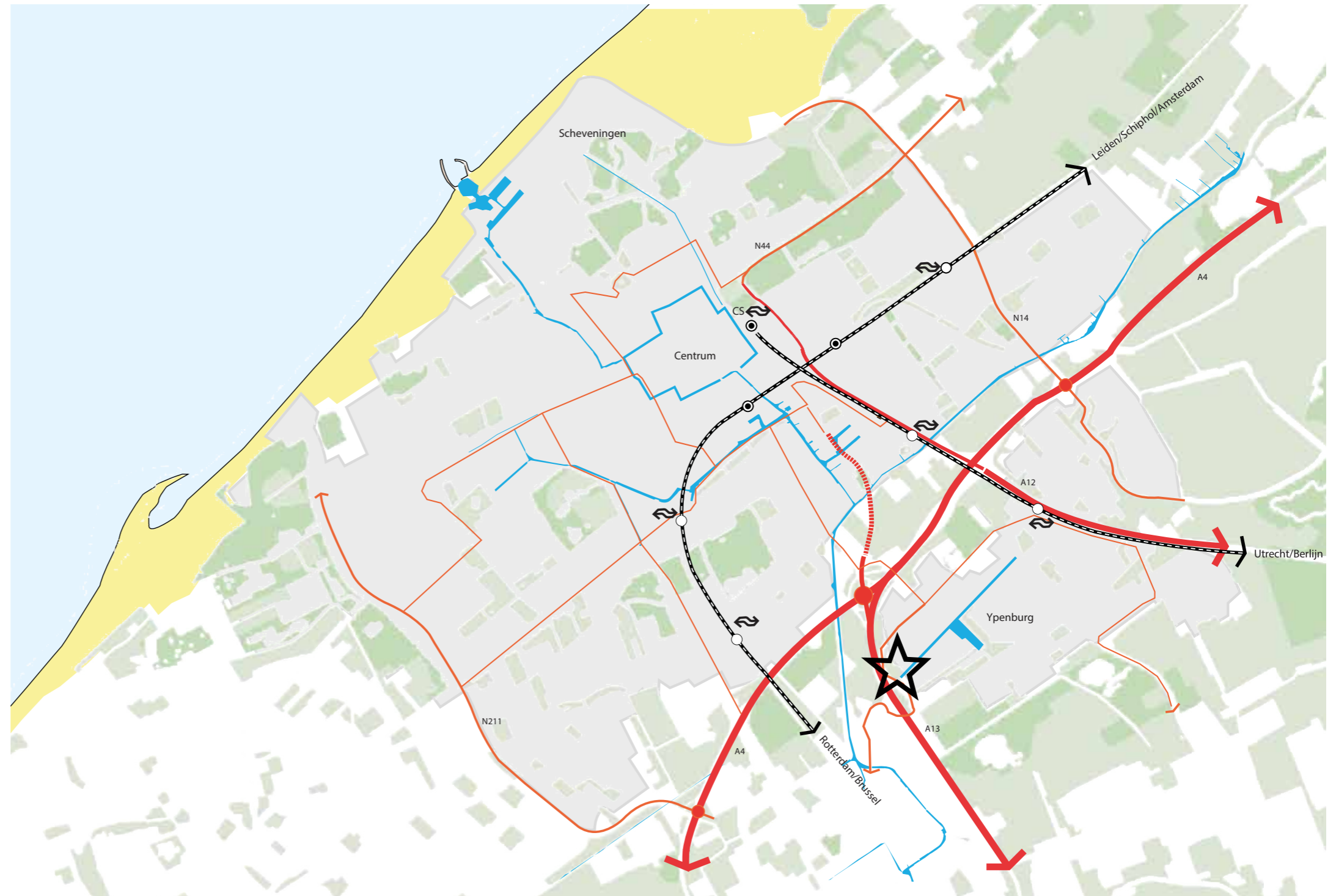
ligging groengebied aan de Bieremalaan in Den Haag