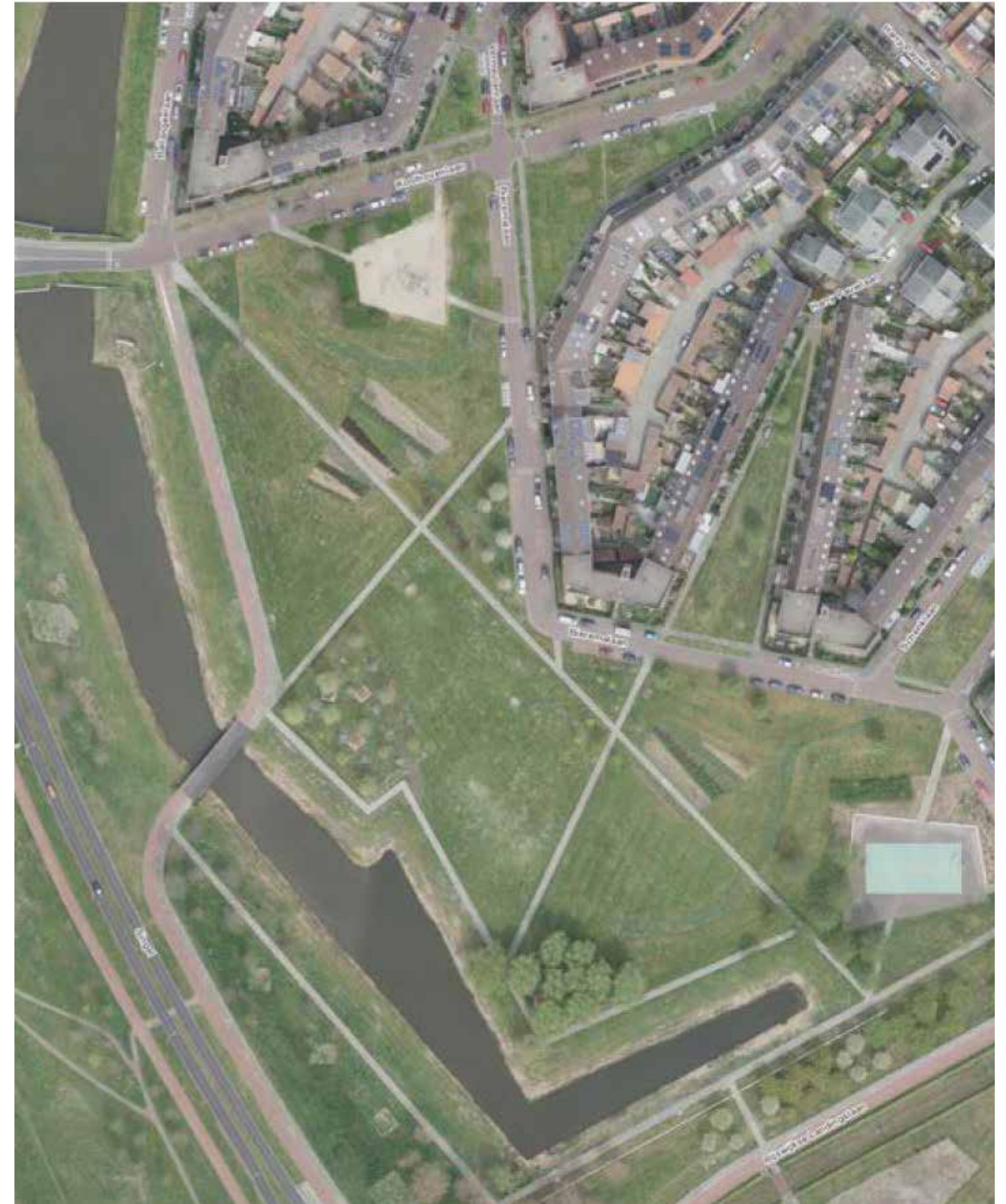
luchtfoto huidige locatie 2023