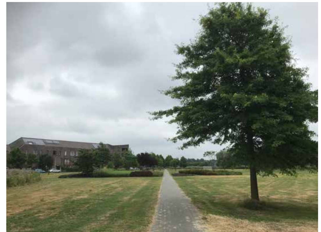
na vergroening 2013 en 2019