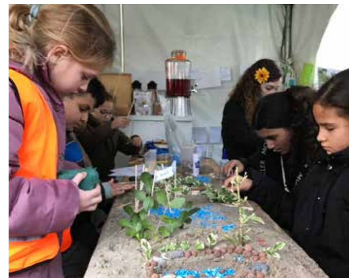
kinderen aan de slag

1-Kinderen willen graag uitdagende speelaanleidingen op, over, naast en zelfs onder het pad. Bijvoorbeeld een leuke poort aan het begin en eind van het speelpad, klimbomen. Volwassenen vullen dit aan met; het pad moet ook goed toegankelijk zijn voor volwassenen met een scootmobiel/rolstoel/rollator.