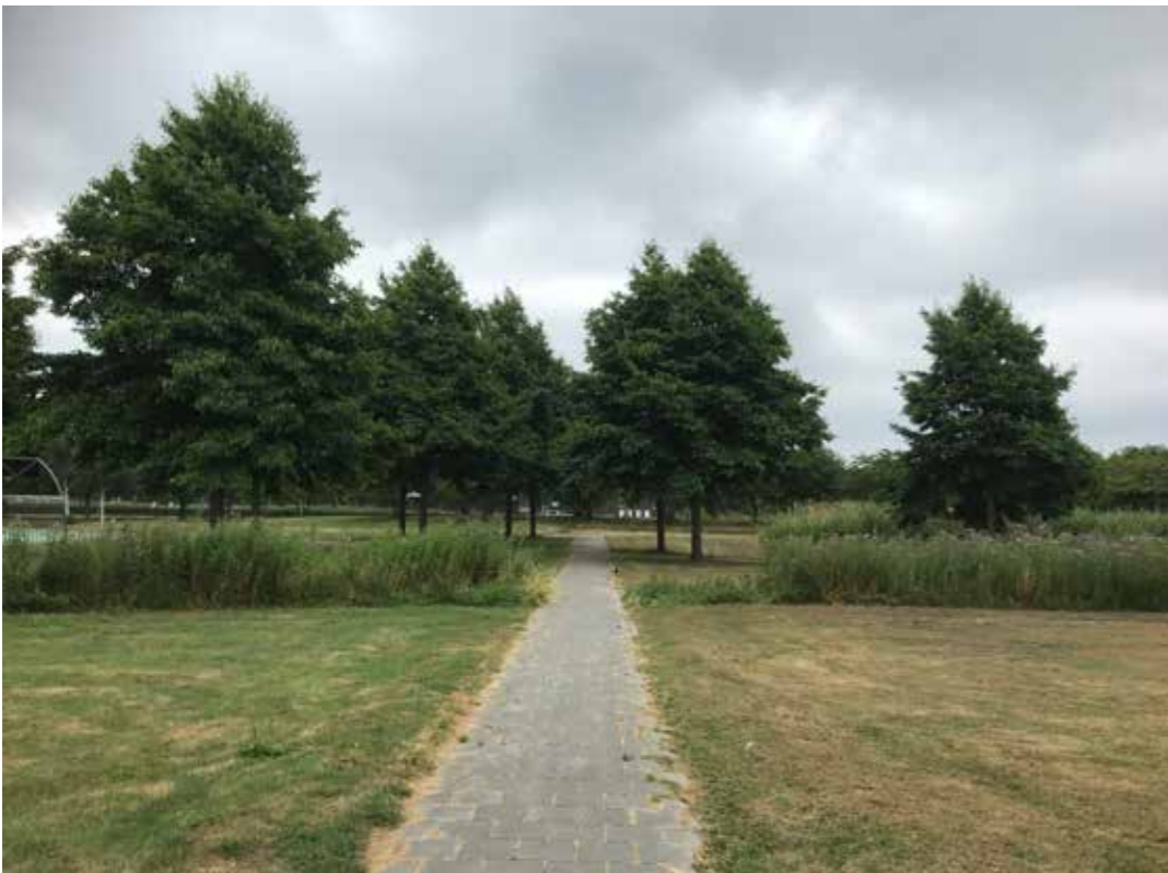
einde pad (lange lijn) door bollenlint