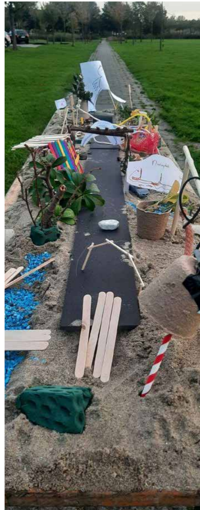
resultaat van de participatiemiddag

Iedereen gaf aan graag op de hoogte te willen blijven van de vorderingen en mee te willen denken over het realiseren van een positieve samenspeelcultuur én community als de samenspeelplek er eenmaal is.