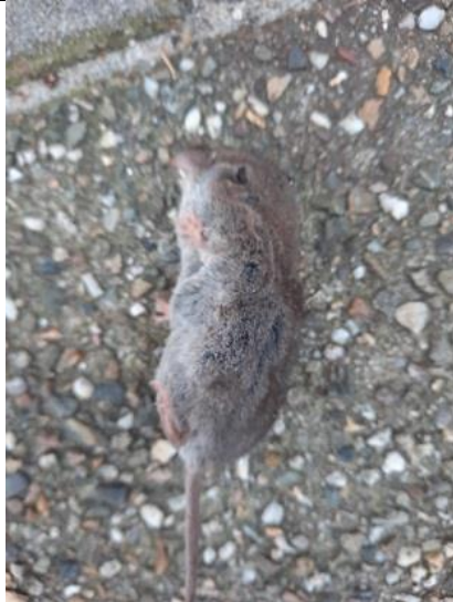
2/12, huisspitsmuis , Wezelstraat, Delft, Geert van Poelgeest