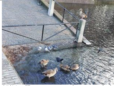
25/11, nijlganzen, waterhoen, stadsduiven , Hofvijver, Den Haag, Lia Claus