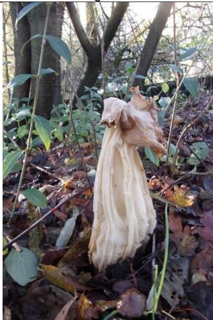
30/11, kluifzwam , pad Buitenhof, Delft, Freek Boon

Op de platanen aan de Thijsseweg in Delft onder de schors gekeken. We vonden zeer veel insecten, spinnen en pissebedden: weegbreesnuitkever , Crepidodera plutus ( bladhaantje ), ruwe pissebed , behaard lieveheersbeestje , buxusrenspin , grote viervlekschorsloper , kustschorsloper