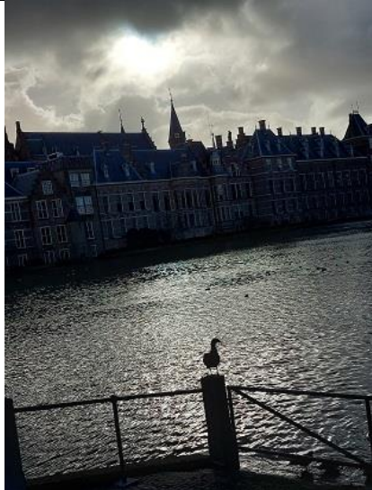
25/11, Hofvijver wolk in hart vorm boven het torentje, Den Haag, Lia Claus