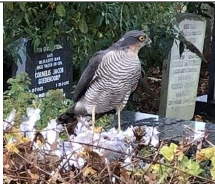
25/11, sperwer , algemene begraafplaats in Maasland, Frans Plieger

Nb. De afspraak in de vogelwereld is dat foto's met nesten en eieren niet worden gepubliceerd om ze niet te verstoren. We zullen dus alleen de waarneming in de Nieuwsbrief opnemen.