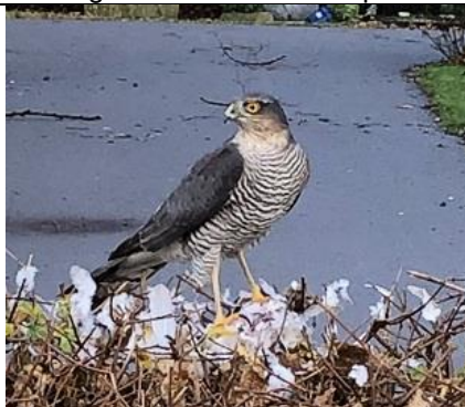
Deze vrouwtjes sperwer liet me heel dichtbij komen. Ondertussen ging ze rustig door met plukken van haar prooi, een duif.