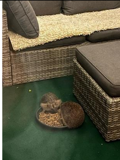
27/09, deze egels komen al jaren bij ons elke avond eten, Terheijde, Samantha Steenbergen