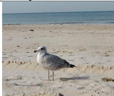
27/09, pontische meeuw? , Kijkduin, Lia Claus