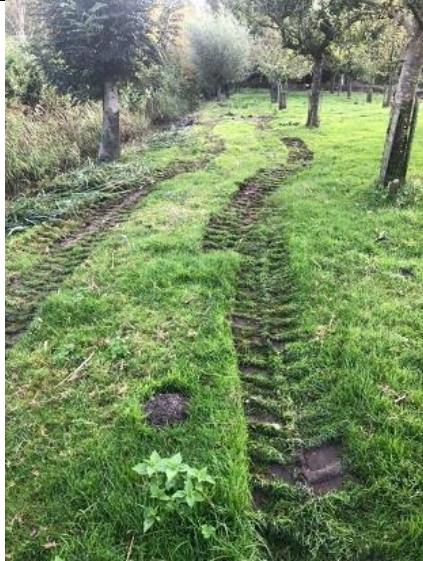
25/09, sloten op Veelust gemaaid, Jantine Pol

Door de aannemer van SBB zijn de sloten gemaaid. Dat was wel nodig. Daarbij is wel enig nieuw micro-reliëf ontstaan, zie foto Jantine Pol.