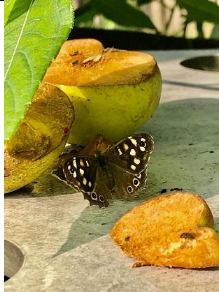
30/09, bont zandogje op kweeper , boomgaard Veelust, Abtswoude, Delft, Jantine Pol