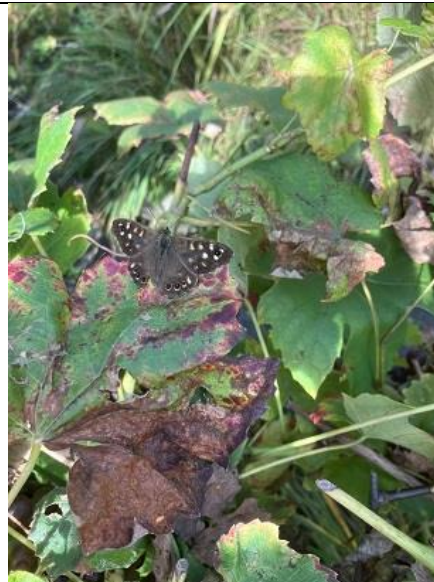
1/10, bont zandogje , kindertuin De Boterbloem, Delft, Bruun van der Steuijt