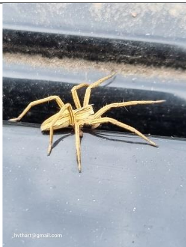
02/10, kraamwebspin , Kwarteltuin, Huub van 't Hart

Ondanks zijn naam maakt deze spin geen web om prooien te vangen. Dat doet de spin door te jagen. Het web wordt gebruikt als kraamkamer voor de eieren.