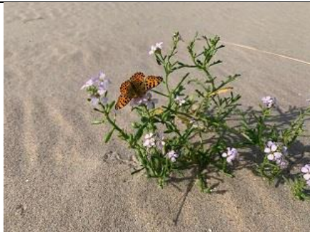
01/10, kleine parelmoervlinder op zeeraket , Zandmotor, Monster, Margreet Hogeweg Ik lees dat het een rode lijst soort is, dus extra bijzonder.