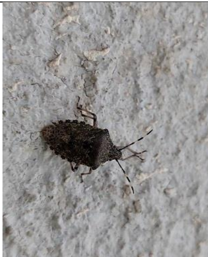
27/09, grauwe schildwands op balkon. Aziëlaan, Delft, Lia Claus