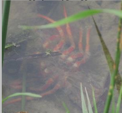
dode Amerikaanse rivierkreeft

In de sloot na het ILSY-plantsoen [ het keerpunt van mijn joggingroute] zag ik het skelet van een Amerikaanse rivierkreeft op de bodem liggen. Ik had ook een bewegend exemplaar op de foto vast willen leggen, maar dat verdween tussen de stengels aan de rand en leverde geen bruikbare foto voor het verslagje op.