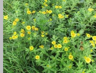
heelblaadjes, tweede bloei

Verder zag ik een opbloei van heelblaadjes : de tweede bloeiperiode. En toen ik dacht dat ik een tumor / gal op gras had gefotografeerd bleek dit bleek cypergras [Cyperus L] te zijn. Gisteren op de reünie van jaargenoten uit Leiden werd ook zegge [Carex] gesuggereerd.