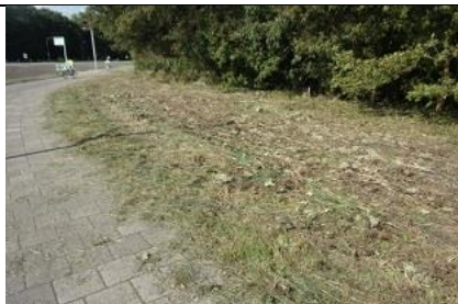
14/9, Beatrixfietspad, de maaiers zijn langs geweest, Freek Boon

Oproep: Kijk uit naar de warterteunisbloem . Een invasief exoot die de sloten en vaarten verstopt en het inheemse leven verdringt. Meld deze via NatuurlijkDelfland@knnv.nl , graag met een foto.