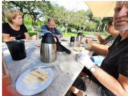
Boomgaard Buitenplaats Vlaardingen