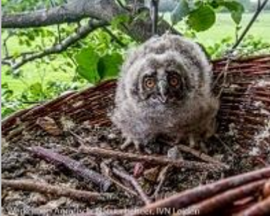
Foto ransuil uit TAUW-rapport.

Het Ontwerpbestemmingsplan Pasgeld West was aan de orde in de raad voor beeldvorming. Tuinvereniging de Volle Grond, Bewonersorganisatie Pasgeld Natuurlijk en natuurorganisatie Natuurlijk Delfland spraken over de onomkeerbare negatieve gevolgen van de bouw van 1000 huizen op zo'n klein oppervlak, waarbij bestaande natuurwaarden, zoals de ransuil, de meervleermuis, de hazen, maar ook de leefbaarheid voor mensen, de nek worden omgedraaid.