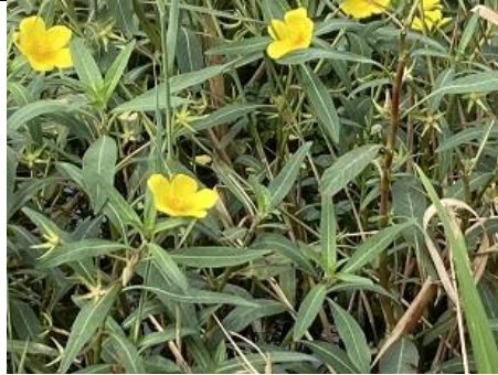
13/09, watertheunisbloem ,