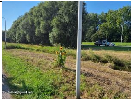
15/9, zonnebloem (nb niet de grijze stengel op de voorgrond), Landbouwpad, Tanthof, Delft, Huub van 't Hart