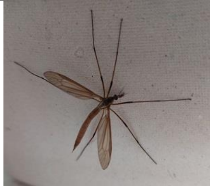
11/09, de langpootmug ( Tipula paludosa ), op balkon, Tanthof, Delft, Lia Claus