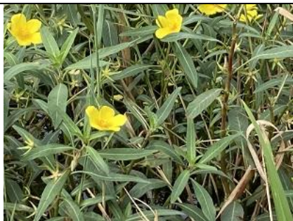
13/9, warterteunisbloem (ca 250 m 2 ), Nootdorp, pad naar molen De Vang, Annemarieke Grinwis

Deze warterteunisbloemen zijn gemeld bij het hoogheemraadschap (hhs). Het gaat hier om ca. 250 m 2 , dus explosieve groei van deze invasieve exoot. Het hhs kan nu actie ondernemen.