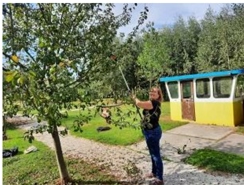
Boomgaard World Art Centre

Er is op twee boomgaarden gesnoeid, vooral de pruimen zijn gedaan