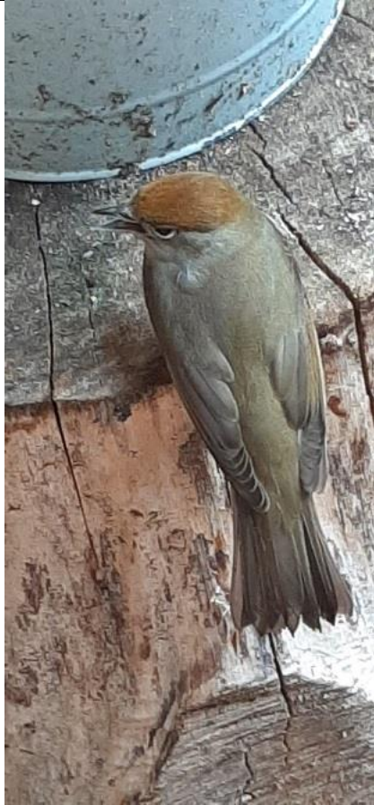
12/09, zwartkop , was tegen de ruit gevlogen in de achtertuin Otterlaan, Tanthof Oost, Delft, Ben Lemmers