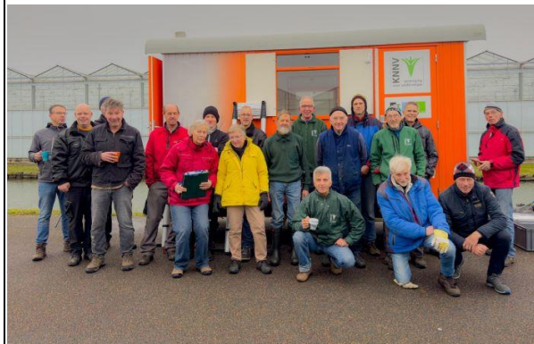
De Knotploeg in Westland