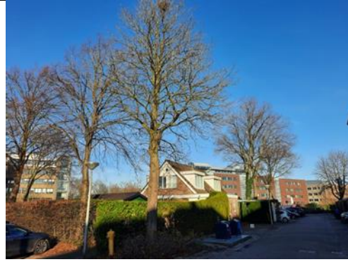
Een kastanje in de Wezelstraat

Een lid moest thuis blijven, we zijn ben hem geweest, in een tiny huis aan de Vulcanusweg in Delft. Erg leuk, ons groepje kon er prima in. Het voornemen is genomen om elke maand een foto van een boom te nemen. We gaan het Agnetapark bezoeken om daar te bomen te bekijken. Ben je geïnteresseerd in bomen? Stuur een email aan medewerkernatuurlijkdelfland@gmail.com.