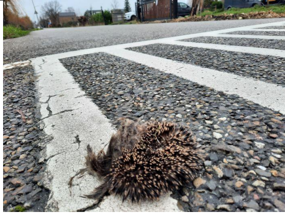
16 december, egel, verkeersslachtoffer, Noordeindseweg, Delfgauw, Geert