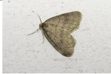
15/12, kleine wintervlinder , Frans Coppens