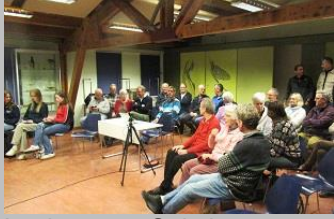
Lezing over Spitsbergen

van In Holland waren aanwezig om een verslag te maken in het kader van hun studie!