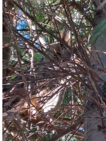
Ransuil, Jolande Sluyter

Het is een typische ransuilfoto, omdat ze graag verborgen in groenblijvende coniferen hun omgeving in de gaten houden. De ransuil is (een van de) onderwerp(en) van een kort geding bij de Raad van State op 30 januari tegen het kappen van de boomsingel met het ransuilnest. Het gaat hard achteruit met de ransuil in de provincie Zuid-Holland. Pasgeld en dan in het bijzonder de locatie van De Schoffel is een van de weinige plekken waar een paartje elk jaar weer jongen grootbrengt. Bewonersorganisatie Pasgeld Natuurlijk en Natuurlijk Delfland hebben dat kort geding aangespannen.