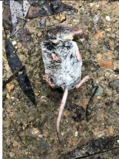
18/12, dode spitsmuis , Delftse Hout, Delft, Jolanda