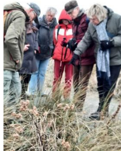
Team Paddenstoelen op pad