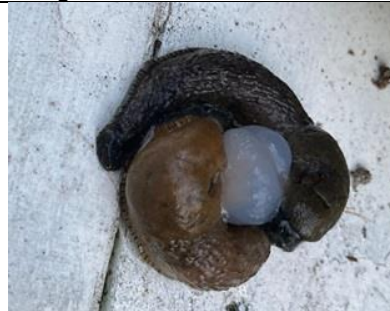
28/8, jonge slakken in wording, Anneke van Swieten