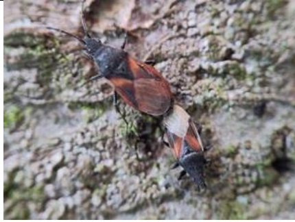
31/8 lindenspitskop , Oostplantsoen, Delft, Patrick Ehlert

De lindenspitskop is een tamelijk zeldzame wants die door klimaatverandering vanuit het Middellandse zeegebied naar het noorden oprukt. In 2008 was de eerste waarneming in Nederland, maar door de zachter wordende winters wordt deze steeds vaker gezien. Zoals de naam al zegt, vooral te vinden op lindebomen.