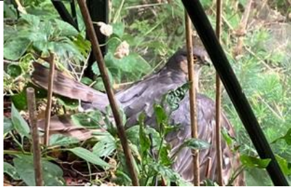
4/8, een sperwer in onze kas, Ypenburg, Den Haag, Tanja Verbeeten en Peter Jasperse