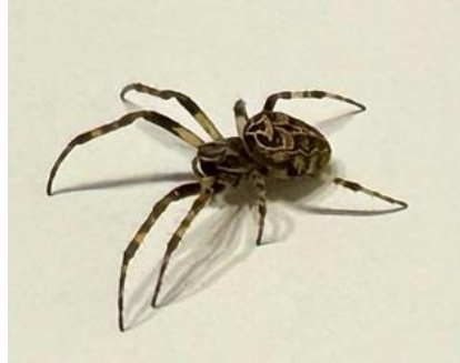
27/8, brugspin (Iaranoides), Bart Hendriks, Delfgauw

26/8, "Ik heb maandag bij de Poldervaart een voor Nederland uitgestorven gewaande hommel herontdekt: de lichte