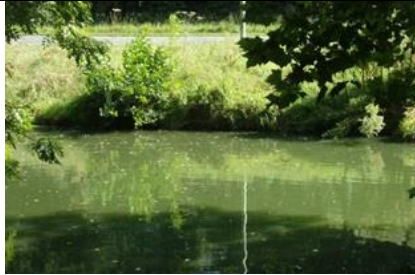
31/8, sloot Beatrixlaan (Westzijde), Delft, Freek Boon

De lindenspitskop is een tamelijk zeldzame wants die door klimaatverandering vanuit het Middellandse zeegebied naar het noorden oprukt. In 2008 was de eerste waarneming in Nederland, maar door de zachter wordende winters wordt deze steeds vaker gezien. Zoals de naam al zegt, vooral te vinden op lindebomen.