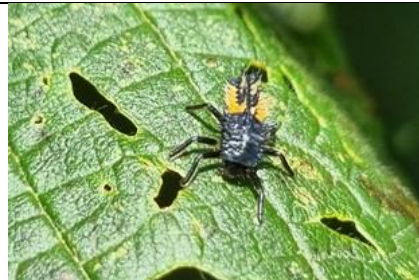
30/8, Aziatisch lieveheersbeestje (larve), Kwarteltuin, Delft, Huub van 't Hart.