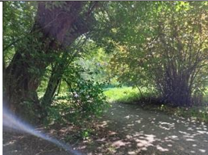
28/8, lambertsnoot (links), kerspruim (rechts), Heemtuin Delftse Hout, Lia Claus