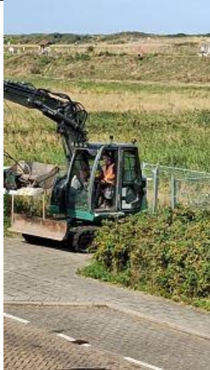
Firma Berkhout uit Schipluiden