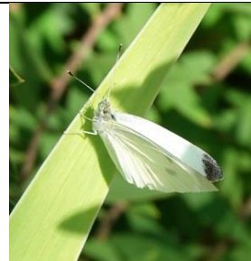
1/9, klein koolwitje , Naaldwijk, Aad van Uffelen