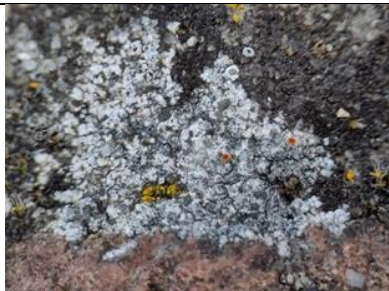
31/8 zuidelijke citroenkorst , Oostsingel, Delft, Patrick Ehlert

Ook bij korstmossen is klimaatverandering zichtbaar. Zo wordt de zuidelijke citroenkorst steeds vaker gevonden, ook in onze regio. Kenmerkend voor dit korstmos is het witte thallus in combinatie met blauwgrijze vlekjes (soralen) en vaak ook rode vruchtlichamen (apothecia) met lichtere rand. Met apothecia onmiskenbaar, maar zonder kan deze op de witte citroenkorst lijken. Vooral te vinden op oude bakstenen muurtjes