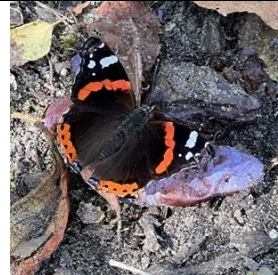
1/9, atalanta , Naaldwijk, Aad van Uffelen