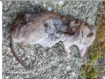
29/8, dode huisspitsmuis , Kwarteltuin, Delft, Johan van 't Hart