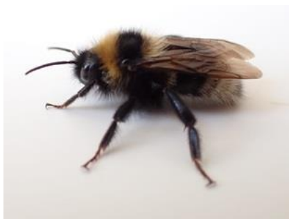
koekoekshommel ", Dominic Dijkshoorn

26/8, "Ik heb maandag bij de Poldervaart een voor Nederland uitgestorven gewaande hommel herontdekt: de lichte