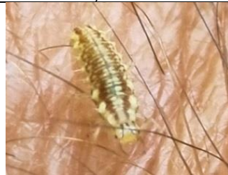
30/8, goudoogje , larve van groene gaasvlieg , Kwarteltuin, Delft, Huub van 't Hart