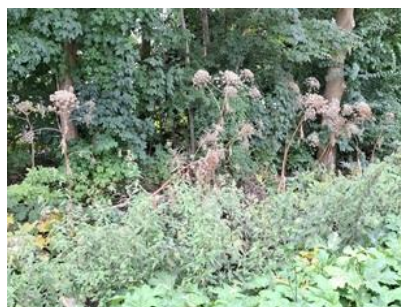
en tweede jaars planten

We kennen geen zomerreces en gaat door met de strijd tegen de reuzenberenklauwen. Er verschenen vier brigadisten op het appel en zijn de eerstejaars planten uitgestoken achter de geluidsschermen van de A13. Er staan er zoveel dat het net peentjes oogsten is. Na goed steken kan een heel bosje reuzenberenklauwen uitgetrokken worden. Ton Langeveld