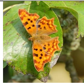
1/9, gehakelde aurelia , Naaldwijk, Aad van Uffelen