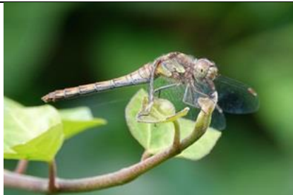
1/9, bruinrode heidelibelle , Naaldwijk, Aad van Uffelen