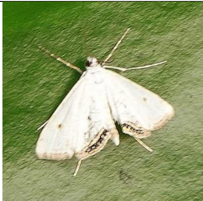
1/9, kroosvlindertje , Naaldwijk, Aad van Uffelen