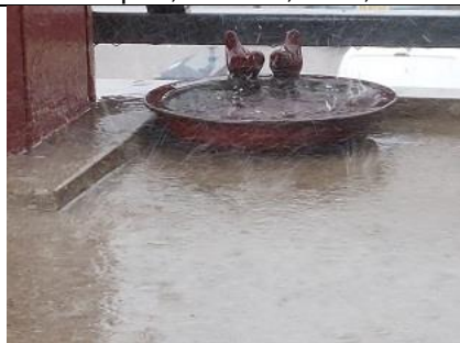
26/08, bij thuiskomst vogel drinkbak gevuld met veel regen, Lia Claus