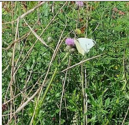
26/08, één van de vele koolwitjes , Kruithuispad, Tanthof, Delft, Lia Claus