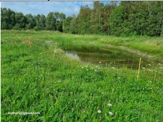
De nieuwe paddenpoel

Agrarische Natuurvereniging Vockestaert onderhoudt hier de Vlinderbiotop, jaarlijks gemonitord door Natuurlijk Delfland. Samen met SBB wordt dan het maaibeheer besproken.