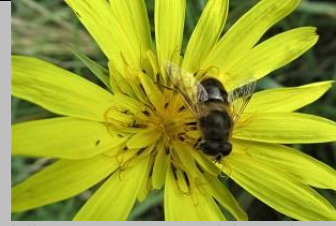
bij op morgensterbloemhoofdje

De natuur is echt op haar retour = terugkeer ! Veel planten zijn weer gaan bloeien na de laatste weken met regenval.