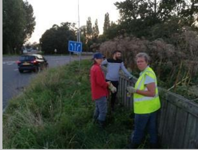
en ná het steken