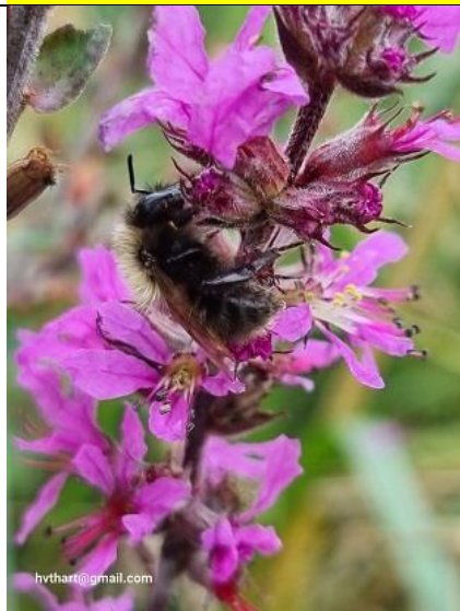
22/08, kattenstaartdikpoot op grote kattenstaart , Abtswoudsepark, Delft, Huub van 't Hart

Nb. De afspraak in de vogelwereld is dat foto's met nesten en eieren niet worden gepubliceerd om ze niet te verstoren. We zullen dus alleen de waarneming in de Nieuwsbrief opnemen.