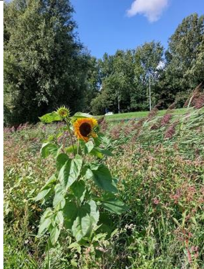
26/08, zonnebloem , Kruithuispad, Delft, Lia Claus