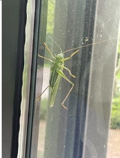
24/08, grote groene sabelsprinkhaan , Elly Honders