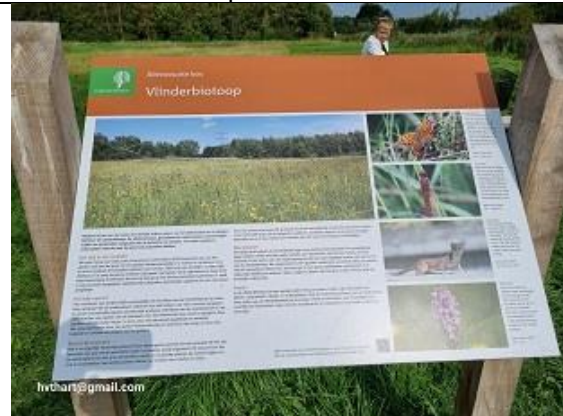
en het uitgebreide infobord