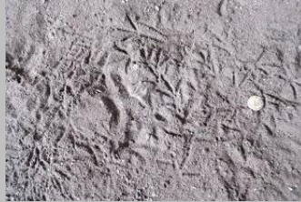
van wie zouden deze pootafdrukken nu zijn?