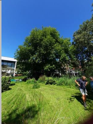
en op 23 augustus j.l.