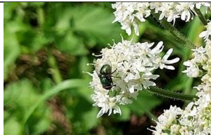
26/08, engelwortel met groene vleesvlieg , Kruithuispad Tanthof, Delft, Lia Claus