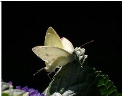
25/7, groot koolwitje , Pi tuin, Anna Kreffer