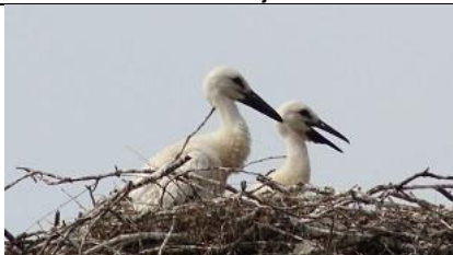
19/07, jonge ooievaars , Hertenkamp, Delft, Bart Hendriks