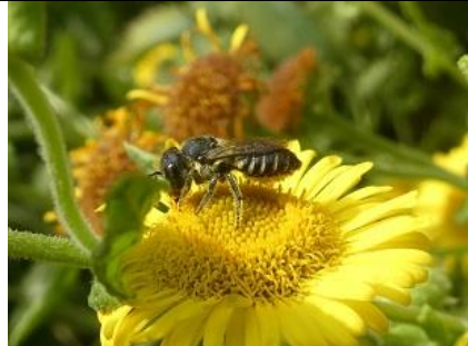
24/07, behangersbijtje op heelbladjes , Den Hoorn, Willemein