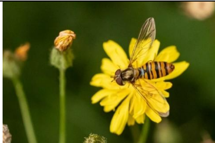
28/7, snorzweefvlieg , Jos Bolte