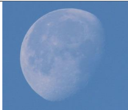
19/07, maan om 7.00 uur, Bart Hendriks