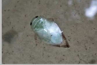
platte waterwants (larve-nimf) ooievaar

Tot slot vandaag tijdens mijn tocht over het fietspad langs de A13: een ooievaar op het noordelijke talud . Meestal zag ik daar als langpoot blauwe reigers staan.