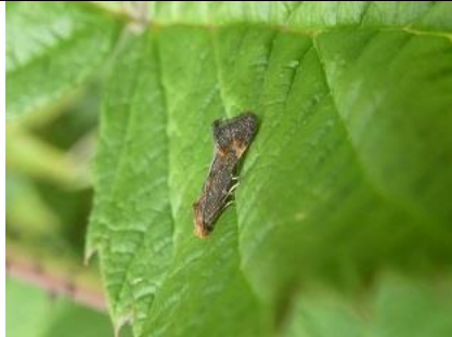
24/07, heelbladjespalpmot zeldzame microvlinder op heelbladjes , Den Hoorn, Willemein

Mieren zijn de vuilnismannen in de natuur. Ze hebben een dode kruisspin gevonden op de groene bak en slepen hem naar hun nest, waar het beestje vakkundig wordt gerecycled.