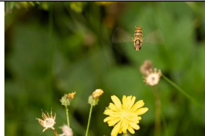
28/7, snorzweefvlieg , Jos Bolte