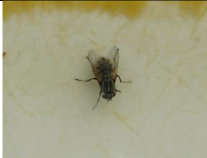
15/7, herfstvlieg , Abtwoudsebos midden, Delft, Aukje Gjaltema