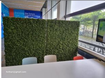
27/07, staande wanden met levend mos , geplaatst op de begane grond van TUD EWI-faculteit Mekelpark. Benieuwd hoe dit verder gaat, Huub van 't Hart.