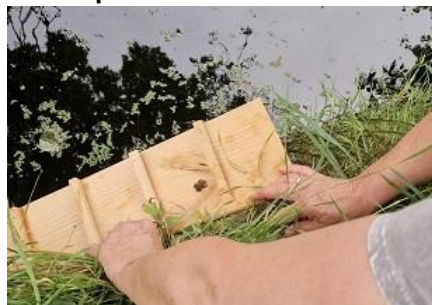
onmiddellijk succes, padje op de trap!

Eén van de trappen zat nog niet eens vastgeschroefd aan de beschoeiing..... toen de eerste gebruiker ervan zich al aandiende: een klein, maar snel en stevig padje. Een beter bewijs dat de trappen functioneel zijn is er niet. Geweldig!