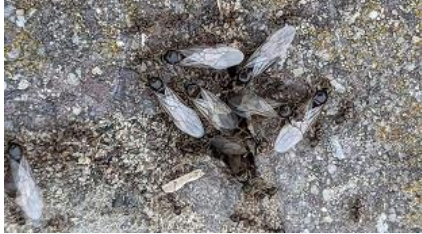
14/07, vliegende mieren , Den Hoorn, Willemein

Nb. De afspraak in de vogelwereld is dat foto's met nesten en eieren niet worden gepubliceerd om ze niet te verstoren. We zullen dus alleen de waarneming in de Nieuwsbrief opnemen.