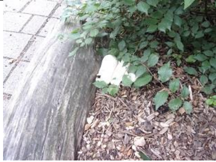
29/7, paddenstoelen , Eglantierschool, Delft, Freek Boon