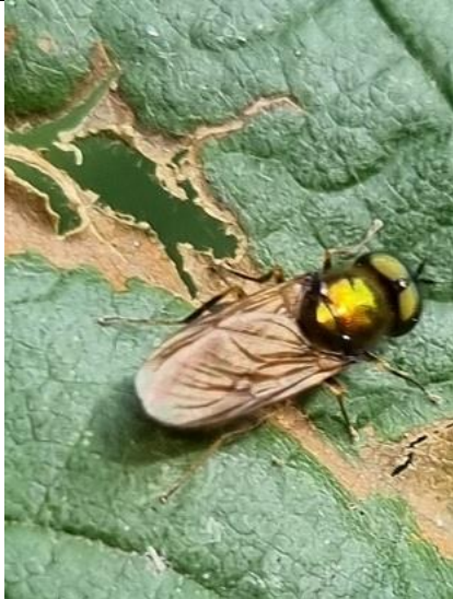
18/07, gewone prachtwapenvlieg , Kwarteltuin, Delft, Huub van 't Hart