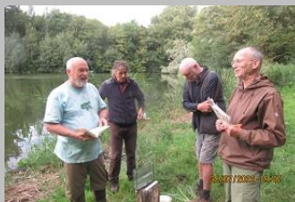
het Team (zonder de fotograaf) meervallen