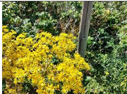
26/7, jacobskruid , Kijkduin, Lia Claus