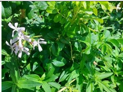
26/7, zeepkruid , Kijkduin, Lia Claus