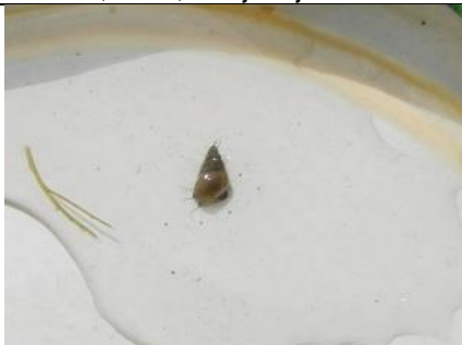
15/7, Jenkins waterhoortje , Abtwoudsebos midden, Delft, Aukje Gjaltema