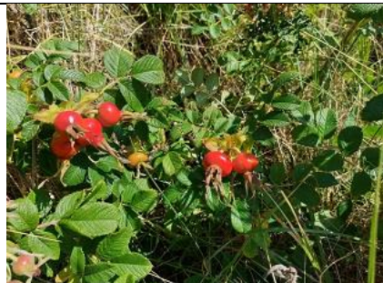
26/7, rozenbottels van wilde roos , Kijkduin, Lia Claus