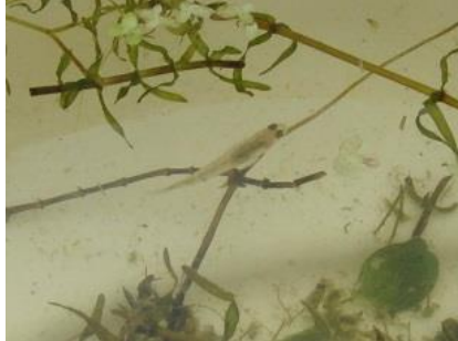
15/7, Kaukasische dwerggrondel , Abtwoudsebos midden, Delft, Aukje Gjaltema