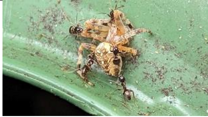
22/07, mieren ruimen dode kruisspin op, Den Hoorn, Willemein

Mieren zijn de vuilnismannen in de natuur. Ze hebben een dode kruisspin gevonden op de groene bak en slepen hem naar hun nest, waar het beestje vakkundig wordt gerecycled.