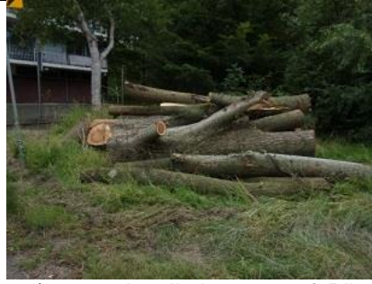
29/7, waar is mijn boom nou? Pijperring, Delft

21/7, roerdomp , Abtswoudse Bos west, Maria van Gaalen