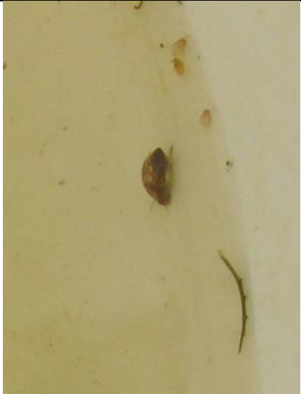
15/7, puntige blaashoorn , Abtwoudsebos midden, Delft, Aukje Gjaltema