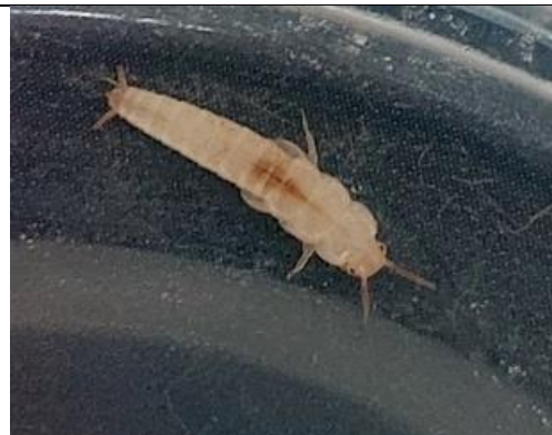
13/08, zilvertisje op 't balkon, Delft, Lia Claus