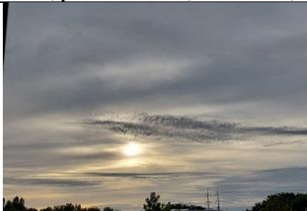
11/08, 20h19, ondergaande zon, Tanthof richting Schipluiden

De parelmoermot, netelmot of gewone brandnetelmot is een vlinder uit de familie van de grasmotten en een van de grootste leden uit die familie. De spanwijdte bedraagt 26 tot 40 mm. Naast Atalanta óók zo'n vlinder om wat brandnetels voor in de tuin te laten staan.