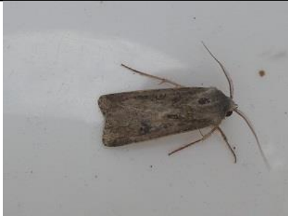
08/08, gewone velduil , Den Hoorn, Willemein