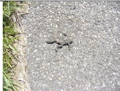
12/08, dode pad , Tramkade, Schipluiden, Freek Boon