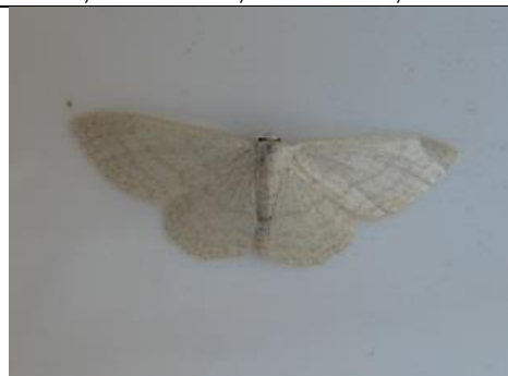
10/08, satiinstipspanner , Den Hoorn, Willemein