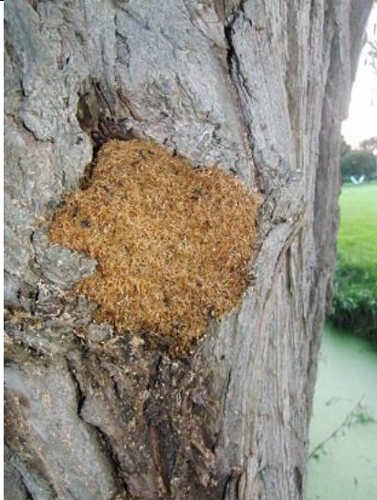
07/08, mieren nest in knotwilg, Vietnampad, Delft, Lia Claus

Ik dacht eerst dat het een soort zwam was, op de stam van een knotwilg aan het Vietnampad, maar nee, het waren mieren die bezig waren zaagsel naar buiten te slepen. Die maken een lekker warm nest voor de winter!