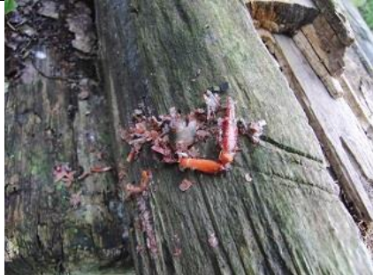
05/08, dode rode Amerikaanse rivierkreeft , Abtswoudse Bos, Delft, Aukje Gjaltema

Nb. De afspraak in de vogelwereld is dat foto's met nesten en eieren niet worden gepubliceerd om ze niet te verstoren. We zullen dus alleen de waarneming in de Nieuwsbrief opnemen.