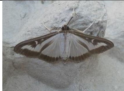
08/08, buxusmot , Den Hoorn, Willemein