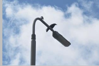
kraaiende kraai en ekster

Op de terugweg over het viaduct naar de Brasserskade zag ik een paar koolwitjes die aan het foerageren waren op jakobskruiskruid .