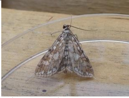
10/08, waterleliemot , Den Hoorn, Willemein