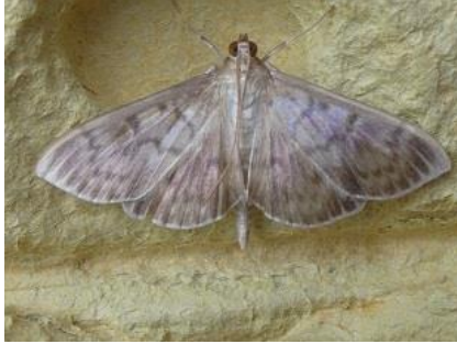
10/08, parelmoermot , Den Hoorn, Willemein

De parelmoermot, netelmot of gewone brandnetelmot is een vlinder uit de familie van de grasmotten en een van de grootste leden uit die familie. De spanwijdte bedraagt 26 tot 40 mm. Naast Atalanta óók zo'n vlinder om wat brandnetels voor in de tuin te laten staan.