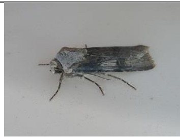
08/08, puta-uil , Den Hoorn, Willemein