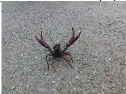
05/08, rode Amerikaanse rivierkreeft , Abtswoudse Bos, Delft, Aukje Gjaltema

Bovenop en stapel dode boomstammen in het Abtswoudse Bos: de restanten van een aantal rode Amerikaanse rivierkreeften . Zo te zien opgegeten en uitgebraakt.