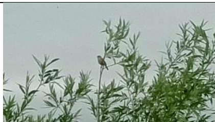
02/06, rietzanger , Delftse Hout, Delft, Kees Kloosterboer

Vandaag slechts één rietzanger gezien en gehoord. Klaarblijkelijk is het seizoen voorbij.