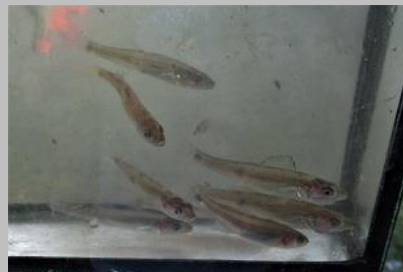
en de oogst

De klapper was de laatste plek bij het gemaal langs de Rotterdamseweg. De oogst bestond uit tiendoornige stekelbaarzen, kleine modderkruipers, rietvoorns, kolblei, zeelt, snoeken, baarzen, snoekbaarzen en twee exoten, de marm grondel en de zwartbek grondel. De snoekbaarzen hebben we voor het eerst in ons werkgebied geschept. In totaal 10 soorten en een zeer geslaagde avond.