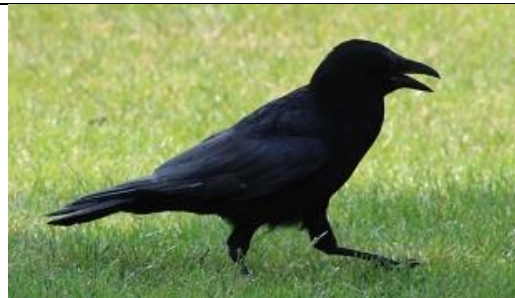
13/06, kraai in de warmte, Delfgauw