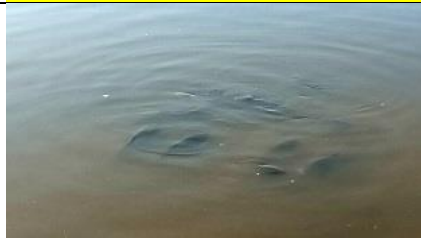
31/05, karpers , Delftse Hout, Delft, Kees Kloosterboer

Nb. De afspraak in de vogelwereld is dat foto's met nesten en eieren niet worden gepubliceerd om ze niet te verstoren. We zullen dus alleen de waarneming in de Nieuwsbrief opnemen.