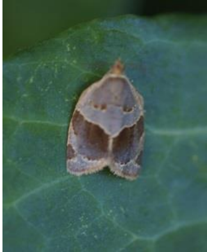
18/06, klimopbladroller , Jan van der Drift

Bij de klimop van de overburen zwermde het van een klein soort vlinders (microlepidoptera). Het bleek na zoeken op het internet te gaan om de klimopbladroller , Clepsis dumicolata .