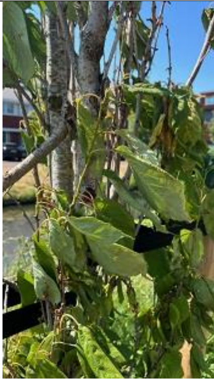
11/06, verdroogde jonge bomen, Kruisbroekweg, Naaldweg, Aad van Uffelen

Kruisbroekweg (Naaldwijk) jonge bomen van dit jaar allemaal verdroogd. 😞😞😞