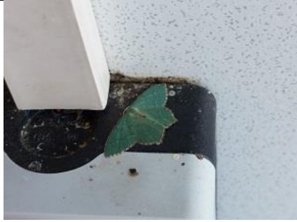
16/06, kleine zomer vlinder op de entree knop van de flat Tanthof, Delft, Lia Claus