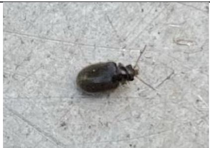
13/06, aardvlo , Delfgauw, Bart Hendiks

13/06, pimpelmees jong, Peter Oeij net uitgevlogen: Pimpelmeespappa en pimpelmees mamma hoeven niet meer te voeren. Er zijn er minstens vijf uit het nest gevlogen. 🐦 happy life guys!