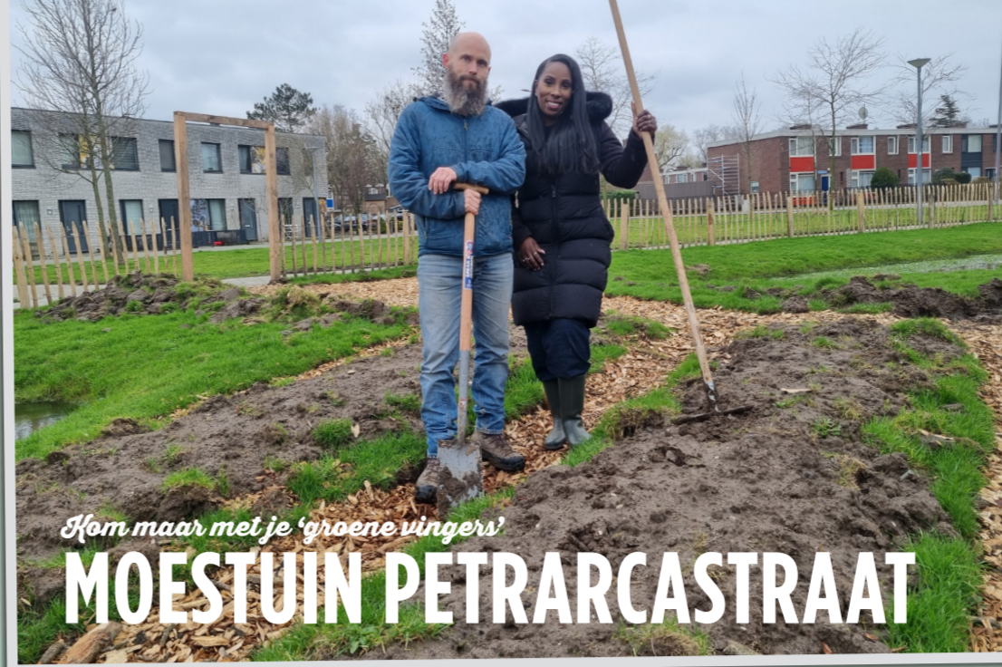
Kom maar met je 'groene vingers'