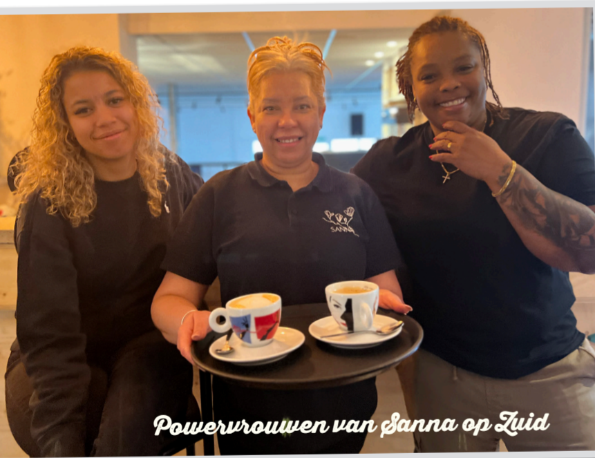
Powervrouwen van Sanna op Zuid

'Als er een probleem is, lossen we het op. We nodigen iedereen uit om onze mooie en gezellige plek in Lombardijen te bezoeken. Bekijk al onze activiteiten rustig nog eens na in de wijkagenda op www.lombardijen.info '