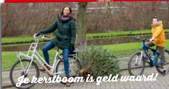
Je kerstboom is geld waard!

Elke woensdag avond worden er workshops aangeboden in Huis van de Wijk. Je kan je aanmelden voor: Rap, Zang, Schrijven/ Spoken Word, Dans, Fashion, DJ, Artwork & SoVa Trainingen. De workshops worden gegeven door professionele docenten die al naam hebben gemaakt binnen hun vakgebied. De lessen vinden plaats van 17:00 tot 20:00. Inschrijven kan op de website: www.unithesestreeets.com/inschrijven