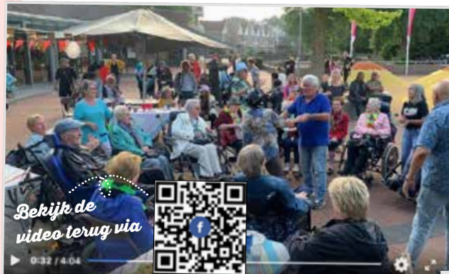
Bekijk de video terug via

Eind augustus werd traditie getrouw de Ouderenvierdaagse georganiseerd. Zowel ouderen als vrijwilligers liepen en reden vier middagen op rij door Beverwaard met elke avond als afsluiter een lekker hapje en drankje. De eindlocatie was elke dag verschillend. Het waren vier geweldige dagen waarbij de verbondenheid in de wijk weer prachtig zichtbaar was.