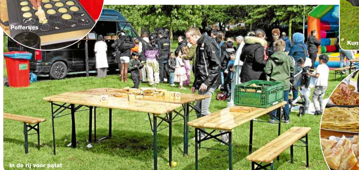
In de rij voor patat