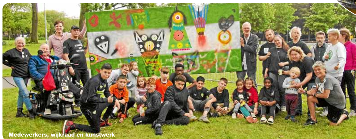
Medewerkers, wijkraad en kunstwerk