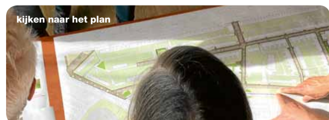
kijken naar het plan

Onder het genot van een drankje en wat lekkers konden de bewoners tekeningen bekijken van het plan. Ze zagen hoe de oude en nieuwe situatie er uit ziet. Op de tekeningen was te zien waar de nieuwe bomen komen, hoe de parkeervoorzieningen worden aangepakt, en hoe de nieuwe speelplaats bij de Weipoort er uit komt te zien. Ook waren er foto's van het bewonersinitiatief bij Voorde 158 en ideeën voor nieuwe beplanting.